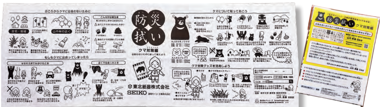
▲いざという時に役立つ、クマ対策のポイントがまとめられた手ぬぐい