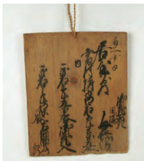
町歴史民俗資料館 (西安庭 15-39-7、木曜日定休)

検地とは、村の耕地を調査して等級を定め、面積を測量して生産高を査定し、課税の基礎とするもので、栗石郷では豊臣秀吉の指令による総検地が慶長3年(西暦1598年)に行われています。この検地札は、慶応2年(西暦1866年)、南部藩最後の御検地の際に検地場所に立てた木製の札です。検地を受ける際の準備や心得の一つとして、田畑・居屋敷とも地主ごとに必要事項を記入した木札を現地に表示することが指示されました。どうぞご覧ください。