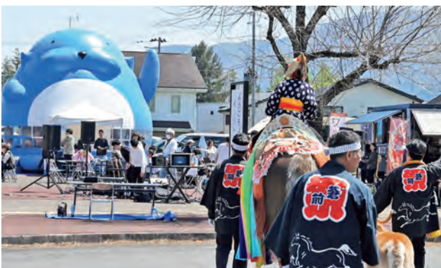
▲盛りだくさんのイベントが行われた2日間