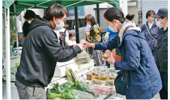
▲新鮮な山菜がたくさん並ぶのも軽トラ市ならではの

よしゃれ通りには、荷台いっぱい商品を集めた軽トラック約60台が整列。来場した約6,400人が、新鮮な野菜や山菜、手作りグルメ、クラフト雑貨などの買い物を楽しみました。