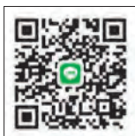
便利なLINE予約はこちら(町民限定)