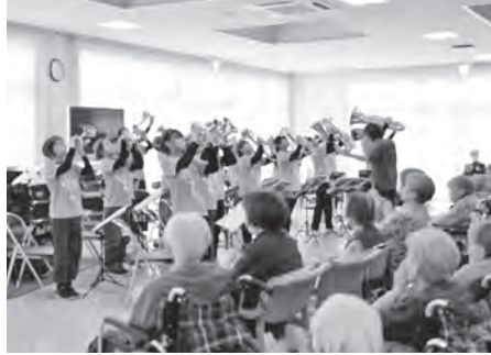
▲七ツ森小学校金管バンドによる福祉施設演奏会