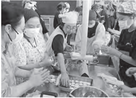
▲お年寄りを招待した雫石中学校の福祉学習