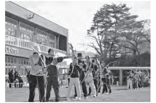
▲昨年開催された雫石町長杯