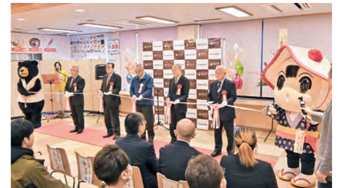
▲関係者が一堂に会しオープンを祝いました