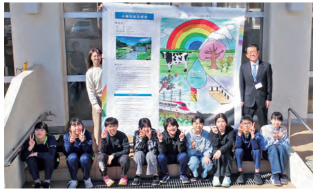
▲御明神小学校6年生の皆さんが作成した案内板 (学年は制作当時)