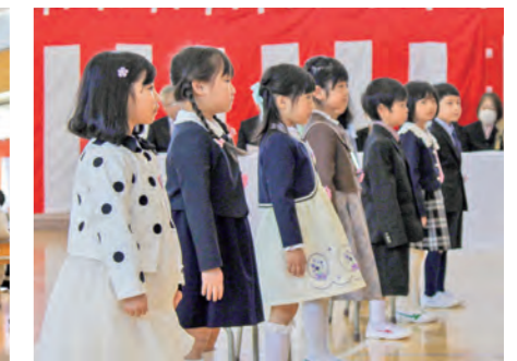
▲緊張した面持ちの新入生(御明神小・8日)