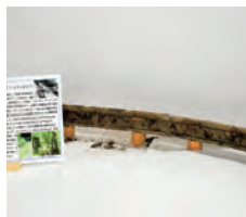
町歴史民俗資料館 (西安庭 15-39-7、 木曜日定休)

森林資源の豊富な雫石町。かつては、雫石川を利用した「流送」が主でしたが、大正11年に「橋場軽便線」が開通し、鉄道による木材運送が行われるようになりました。昭和初期には、鶯宿温泉の奥まで森林鉄道「鶯宿線」が開設され、鶯宿杉を運搬できるようになりました。開設工事はほぼ人力でコンクリート橋脚を架ける難工事でしたが、営林署員の高い技術により、鉄道は崖や川を渡ることでできたのでした。現在は廃線となっていますが、このレールのように痕跡が残っている所もあります。資料館そばにもありますので、ご覧になってはいかがでしょうか。