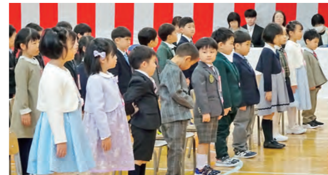
▲友達たくさんできるかな?(雫石小・7日)

今年の新入生は、小学校5校で合計75人、雫石中学校が98人、雫石高校が24人。新1年生たちは新たな場所で、それぞれの一歩を踏み出しました。