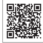
栗石町子育て支援ガイドブック