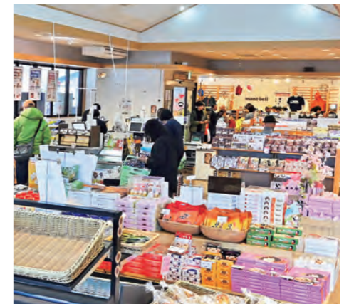
▲レジなどがリニューアルされた物産館