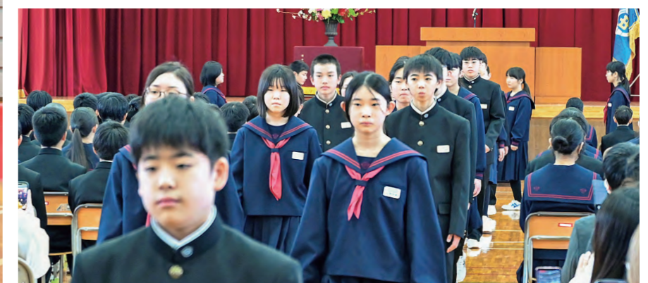
▲多くの人に見守られ退場する新入生(雫石中・7日)