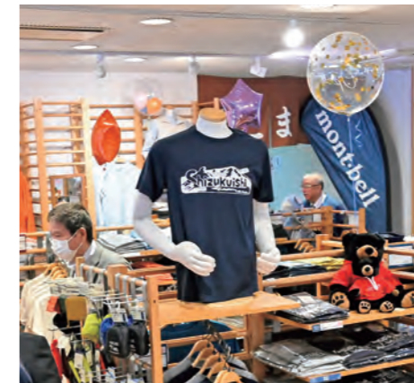
▲他では買えない限定グッズも販売