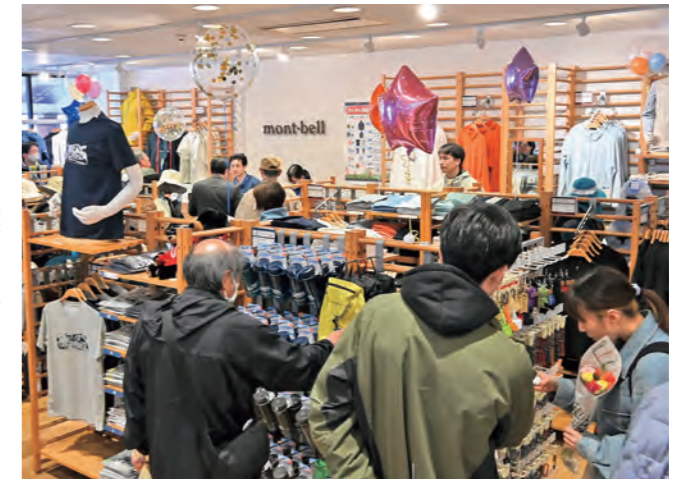
▲多くの買い物客でにぎわうモンベルコーナー

土産物売り場もリニューアルされ、買い物がしやすくなるなど、ますます魅力を高める道の駅雫石あねっこ。皆さま是非ご利用ください。