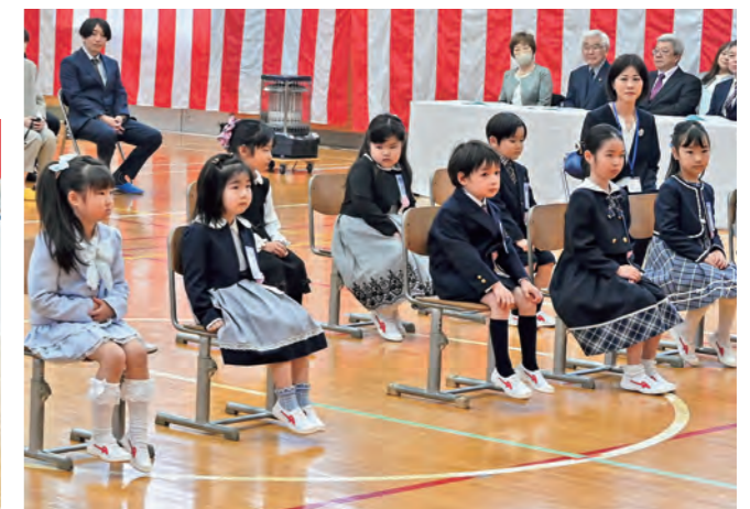
▲校長先生の話に耳を傾けます(西山小・7日)