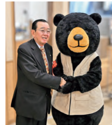
▲モンタベアと仲良くなる猿子町長