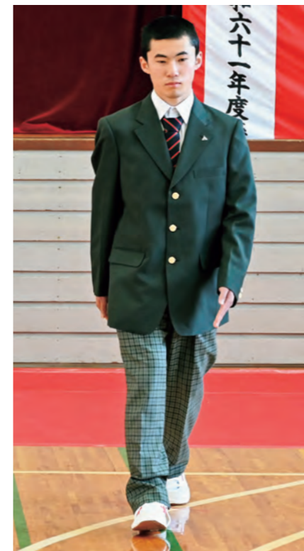
▲力強い足取りで入場(雫石高校・8日)