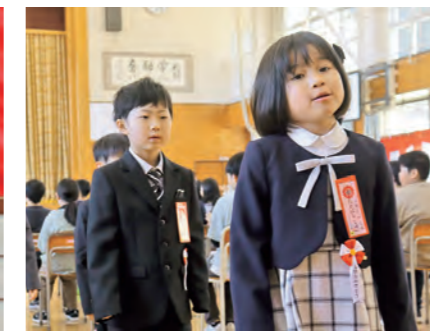
▲新生活への一歩を踏み出します(七ツ森小・8日)