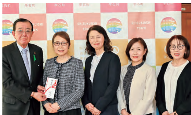
▲細川代表(左から2番目)と細川会の皆さん