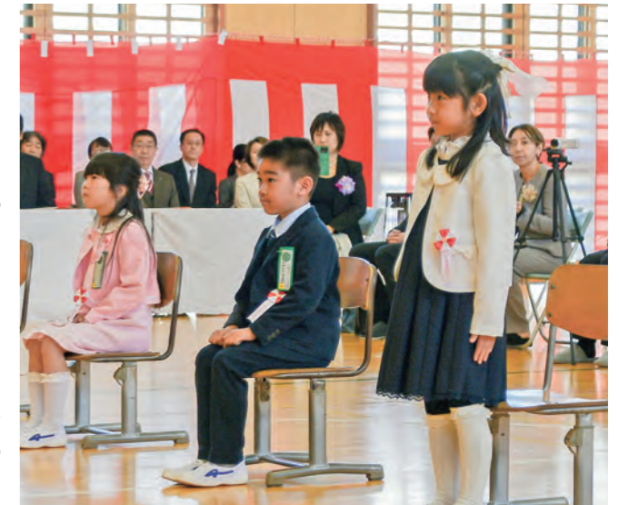
▲名前を呼ばれ、元気に立ち上がる新入生(御所小・8日)