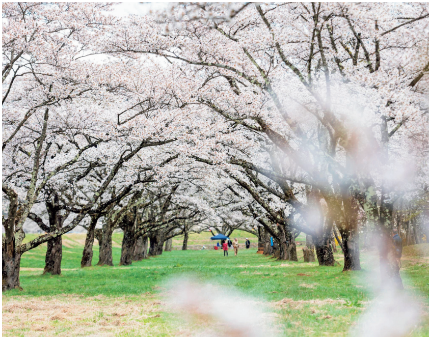
町内の桜スポットは今回紹介した3カ所のほか、赤淵の一本桜やファミリーランドのお花見広場など町内各地に点在しています。ぜひ各所巡ってみてください。