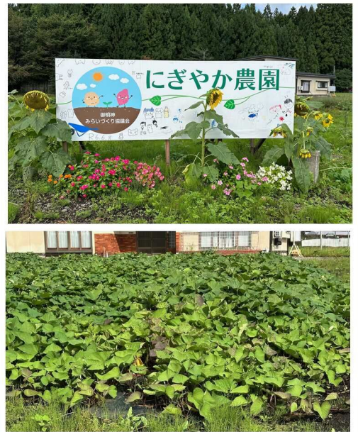
▲9月中旬に撮影したにぎやか農園