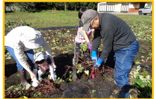
▲昨年収穫した際の様子

□主催 御明神みらいづくり協議会 問合せ先:御明神公民館 TEL:019-692-3228 Mail:myoukou@town.shizukuishi.iwate.jp