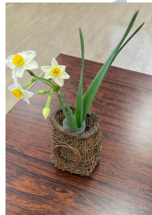
花が小ぶりで可愛らしい スイセンです！