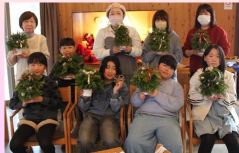
▲自分だけのオリジナルツリーに大満足!