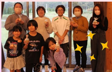
▲大好評につき、第2回目の開催!