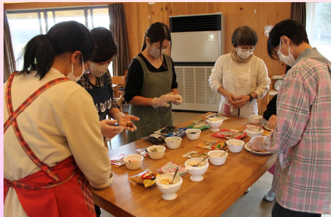
▲好きな具材をみそ玉にしました!