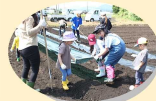
協力してマルチ張り