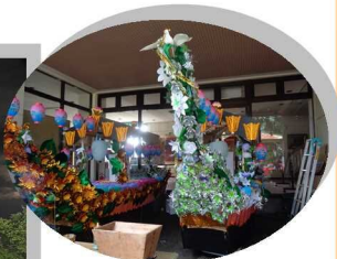
▲昨年の様子 (舟っこ)