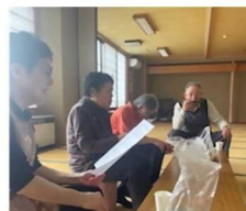
◀締めは幸福のワルツ♪

5月15日は雫石町社会福祉協議会の出前講座としてモルック※を行いました。※木の棒を投げ、数字が書かれたピンを倒し得点を競うゲーム。その後は、メンバーが奏でるハーモニカの音に合わせて歌を楽しみました。