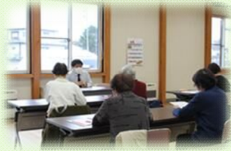
健康についての講話