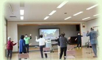
足踏みしながら全身を使った運動

講師である(株)北東北第一興商の音楽健康指導士柳原さんの指導のもとカラオケ機DAMを使用した脳トレや音楽に合わせた運動を行いました!