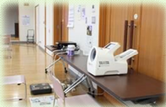
体組成と血圧の測定

脳トレでは「間違えても楽しくやりましょう!」の声掛けに皆さん楽しそうに取り組まれていました。お散歩している気分でその場で足踏みしながら行う運動や、音楽に合わせて全身を動かす運動を行いました。