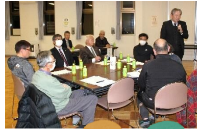
◀ 副会長からのまよめの言葉