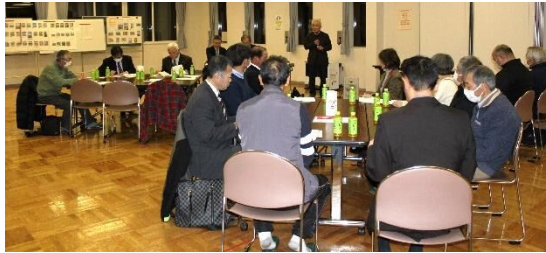
◀ たくさんの意見や質問が出ました