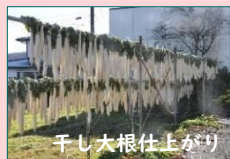
干し大根仕上がり

吊るし干しして約一週間後の11月12日(水)赤滝しずくの会の「おばあちゃん達」により漬け型をして、あとは美味し〜く漬かるまで少〜しお待ちを♡ うま〜く漬かったあとはサロンの皆さんからお手伝いを頂いた方々、地域の皆さんに振る舞われます♪