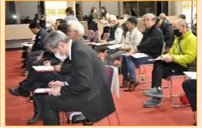
～R6年12月 第1回 地域大交流会の様子～