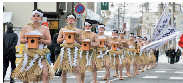
▲たくさんの人に見守られ、着実に歩みを進める