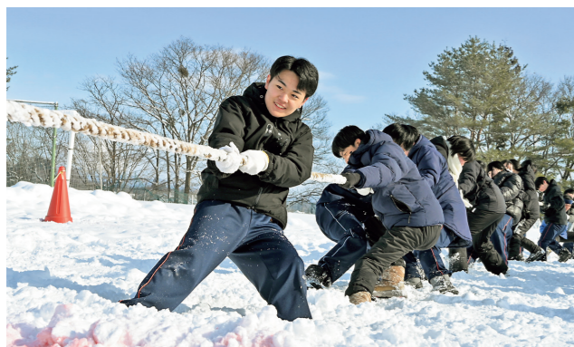
▲深い雪に足を取られながら熱戦を繰り広げる生徒たち