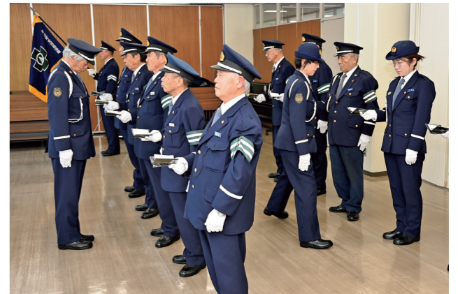
▲手帳と服装の点検を受ける雫石町交通指導隊員

式終了後は、会場をよしゃれ通りに移して分列行進を行い、士気旺盛にして威風堂々の雄姿を披露しました。