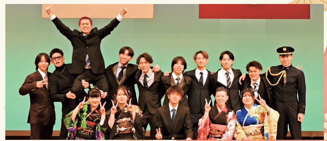
企画から当日の進行まで務めあげた実行委員の皆さん