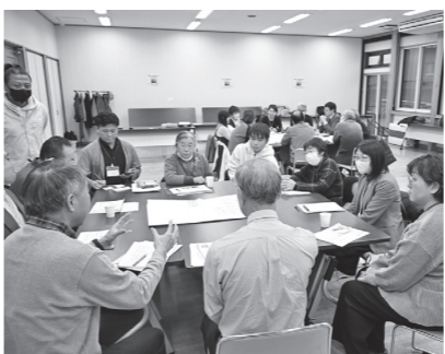
ワークショップでの意見交換の様子

主に自治会や公民館などの役員で構成される有志が集まり、栗石地区内の行政区や自治会など、単体での実施が困難な事業や栗石地区全体での取り組みが効果的な事業に、取り組んでいくことを目指しています。2019年度に地域の役を見直すことからスタート