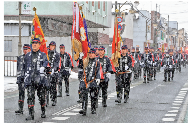
▲雪が舞う中、堂々とした行進を披露する消防団