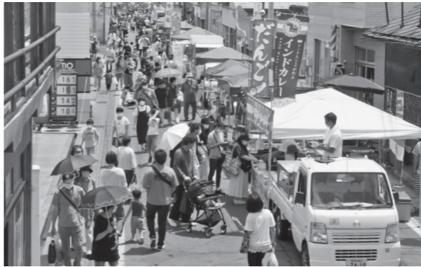
多くの来場者でにぎわう軽トラ市の様子

☎ 692・33321 FAX 692・ 1667 ☎ 692・33321 FAX 692・ 1667 ☎ 692・33321 FAX 692・ 1667