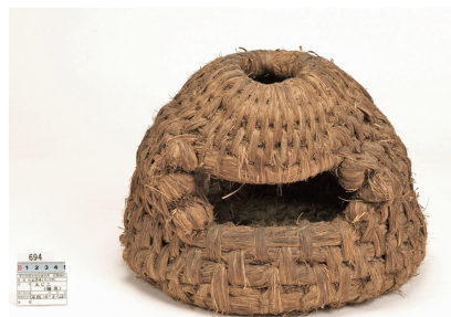
町歴史民俗資料館 (西安庭 15-39-7、木曜日定休)

「えじこ」は、わらで編んだゆりかごのことで、家を長時間離れて農作業などを行う際、屋内または作業場近くに乳幼児を安全に据え置いための道具として使われました。えじこには、飼い猫のために作られた猫用のえじこもあり、かまぐら型をしているのは、猫は暗いところや狭いところに入り込む習性があるため、自分から喜んで入るのだそうです。 ごっそり資料館をご覧ください。