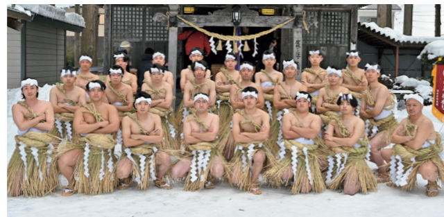
▲歩行祈願を前に気を引き締める参加者ら