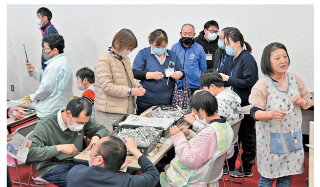
▲共同作業を通して交流を深める参加者ら

座学後は就労継続支援事業所利用者とのワークショップも実施。事業所で行われる作業の実演を目の当たりにした受講者は、利用者の素早い手さばきに舌を巻いていました。