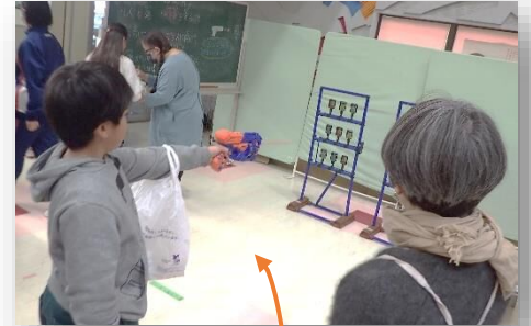
旧プチマート井上の店舗でOZASIKI こうけいしゃ を開催している「好恵舎」は的当て・型抜き・昔遊びのブースを出店☆☆☆