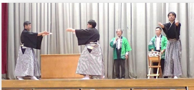
上長山無形文化財振興会による「男よしゃれ」