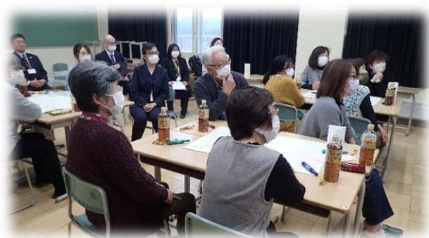
皆川氏 講義資料より