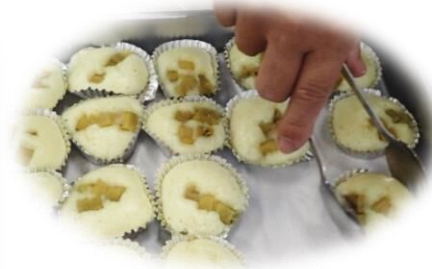
畑ボランティアさんのアドバイスで豊作だったサツマイモの蒸しパン！