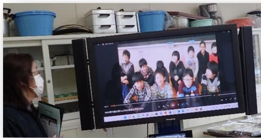
地域に住む特別支援学校児童と、旧下長山小児童との6年間にわたる交流の記録映像を上映しました