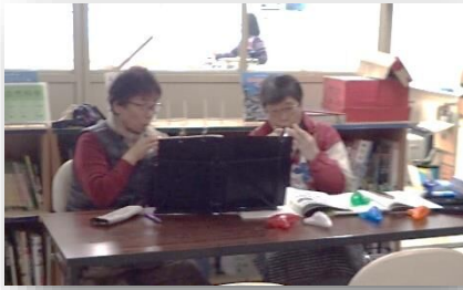
オカリナサークルの優しい音色♪

今年は西山まちづくり会議と共催で行われ、舞台発表も含め8つの地域団体が参加しました。1、2年生は西山保育園の園児と神輿を担ぎ、4～6年生はクラブ活動ごとに出店しました。たんぼぼ・ひまわり学級は畑で収穫したサツマイモの蒸しパンを用意し、岩手大好きクラブが西山小のシンボル樹の「なつめ」の実を煮詰めたお茶で地域の方々をおもてなしました。