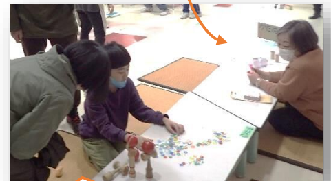
おはじきやけん玉もあるよ♪