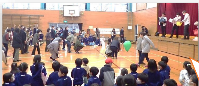
児童や、地域の人を対象に餅まきをしました