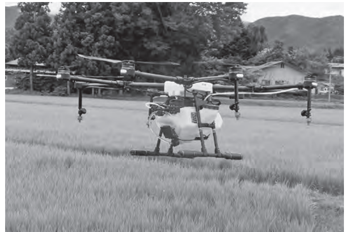
農業散布などで活躍する大型ドローン

答 【農林課長】スマート農業推進事業の導入実績は、1 名がドローン、3 名は花の生産農家であり、ハウスの温度管理等の機器に関する装置を導入している。