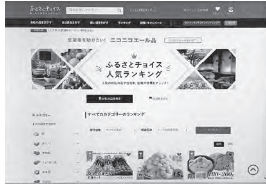
町の大切な財源の一つふるさと納税

答 【政策推進課長】昨年までの事業者に対しては月額・定額だった。今年度は寄付額の10%に件数に応じて加算されるプランに変更した。