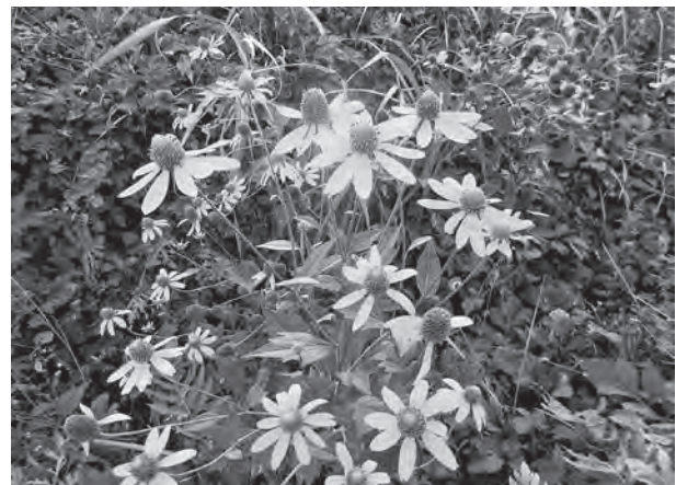
駆除しなければならない外来種オオハンゴンソウ

町長 国の外来種被害防止計画を基に、町が発注している駆除箇所のより効果的、効率的防除や町広報紙、ホームページで広く周知し、地域や関係者による共同防除作業等を検討していく。