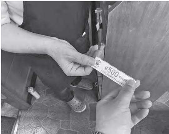
町内で利用されているエンジョイパスポート

教育長 令和2年度から県教育委員会では、新たな魅力化促進事業を雫石高校でも立ち上げ、それと連動しながら雫石高校の魅力発信に努めて行く。