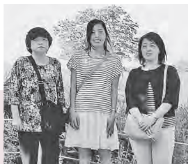
小岩井農場にて (娘2人と)