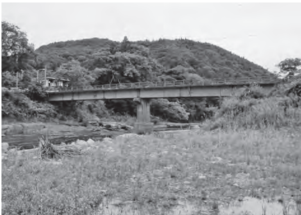
いよいよ着手、昇瀬橋工事