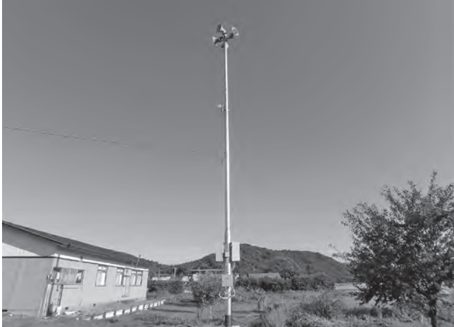
整備が進むデジタル防災行政無線

答 【防災課長】 戸別受信機、スマートフォン、携帯電話、ラジオ、テレビ等で周知する。何重もの形で町民に危険を知らせる。