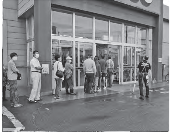
販売時には長蛇の列が見受けられた