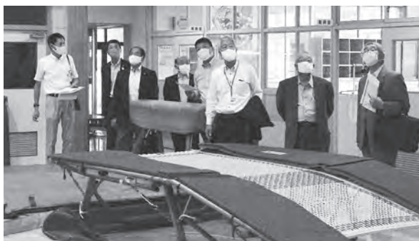
現在、設置されているトランポリンを視察

旧南畑小学校を現地視察しました。体育館、校庭の現状の確認と校舎内のトランポリン・体操教室、プール跡地を活用したスケートボードパークの利用状況の説明を聞きました。