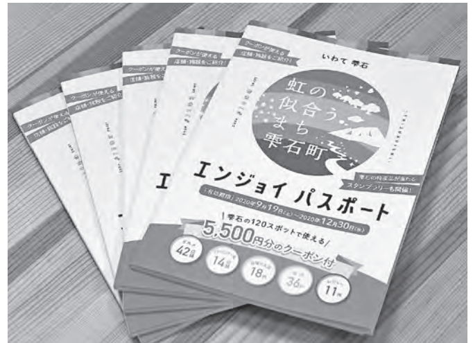
第2弾の発売を期待

答 【政策推進課長】積算についてはパスポート冊子の製作費、店舗への販促支給、テレビやインターネット等宣伝費、印刷製本費と冊子の中にあるクーポン券分の補助などを積み上げた金額である。町への実質的な効果としては3,000万円を超える効果があると積算している。