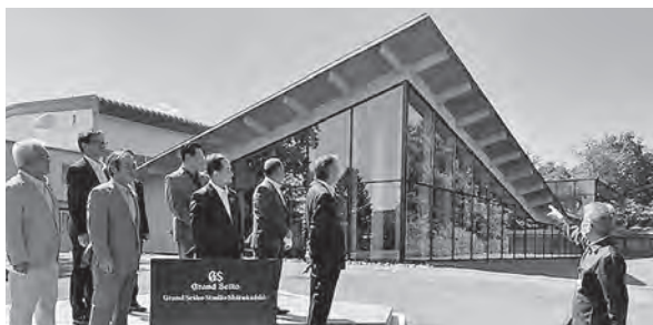
粟石から世界へ発信する企業として期待

また、施設内では自然との共生・調和を目指し、100年の森を次世代に残すため、先を見据えた管理や活動が重要と考えているそうです。