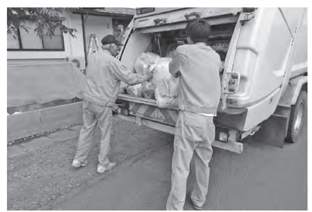
広域処理の資源ごみ、どうなる

御所ダムは、総貯水量6,500万立方メートルに対し、2,000万立方メートルの計画堆砂となっている、令和元年度末の堆積砂土は約850万立方メートルであり計画堆砂以下であるが、平成28年度から継続的に貯水地内の土砂撤去をしていると聞いている。