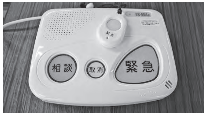
ひとり暮らしの高齢者を守る装置

答 【総合福祉課長】緊急通報装置は、ひとり暮らしの高齢者世帯に、電話での安否確認を図るために設置している。これまでの設置件数は、平成29年度は66件、30年度は57件、令和元年度は49件となっている。