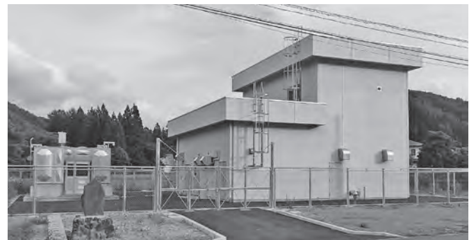
整備された大村地区簡易水道

答 【上下水道課長】 簡易水道加入を進め、経費の削減にも努めながら、収支のバランスが取れるように進めていく。