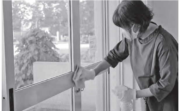
スクールサポートスタッフによる消毒作業

教職員が新型コロナウイルス対応で長時間勤務になったり心身の不調を来すことがないように、働き方改革を徹底し、学校からの相談には適宜、誠実に対応していく。