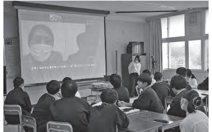
キャリア教育*を真剣に学習する雫石高生

※ キャリア教育…一人一人の社会的・職業的自立に向け、必要な基盤となる能力や態度を育成すること