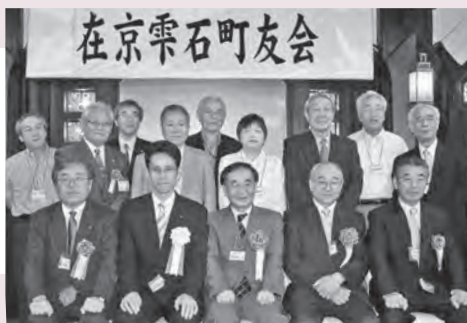
2009年町友会 (後列中央が筆者)

上長山小学校(一時期極楽野分校) — 西山中学校 — 日本メリヤス工業(埼玉) — 太田メリヤス(東京) — 専業主婦 — タワーホール船堀。自治会婦人部長。子供4人、孫1人。趣味カラオケと海外旅行。現在東京都葛飾区在住。