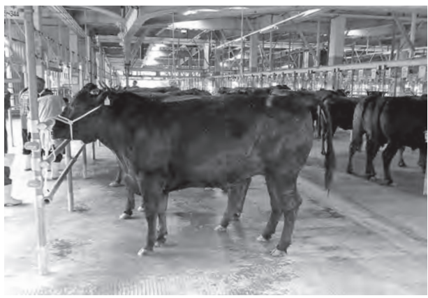
コロナ禍で手厚い支援が必要な畜産農家

町長 社会保障財源にも充てられており、5パーセントに戻すことを要求することはしない。