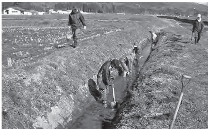
農業用水路の維持管理に取り組む

答 【農林課長】計画を未実施の団体があり返還した。今後は、土地改良区と連携を図り、事務的な部分も含めて来年度以降の本格支援に向けて準備している。