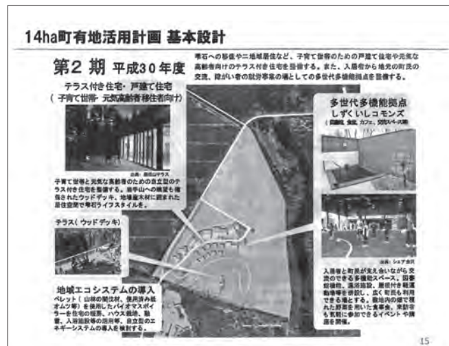
夢、幻に終わった第2期計画