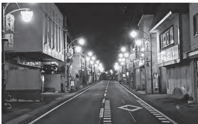
空き店舗対策は急務

【地域整備課長】鶯宿温泉街の空き家については、今年度調査を行い、実態把握に努めている。