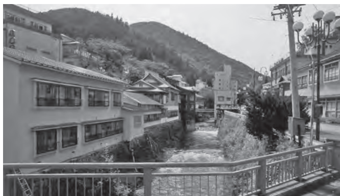
地域住民と一体となった雪まつり開催を

【町長】いろいろな提案の中で、今年は鶯宿温泉をメイン会場にして、鶯宿の人たちを中心に実施し、町がバックアップする方向性で調整している。