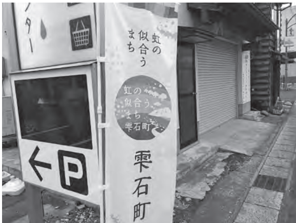
継続した街の魅力の発信を

今回は、当面新型コロナウイルス対策事業として観光PRを優先する。その二次活用に係る目標値は特に定めていない。