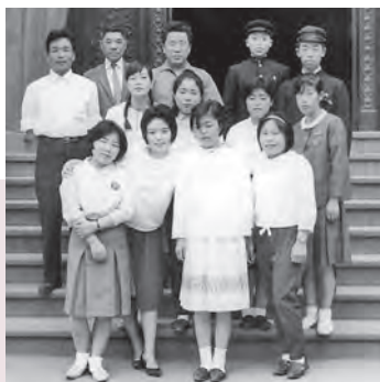
就職で上京した中学の仲間 (前列右から2人目が筆者)

母の葬儀で帰省した10月の晴れた朝に見た“あかね色にそびえ立つ岩手山”の美しさに感動し眼に焼き付いています。今でも雫石の風景は大好きです。