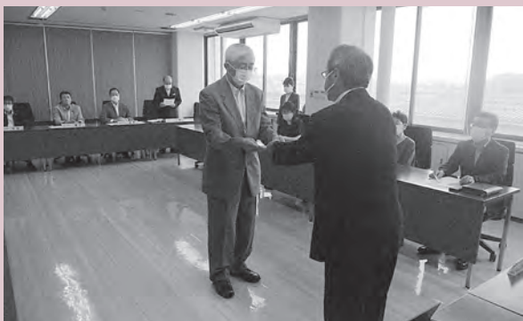
議長から委嘱状を受け取る議会モニター

意見 3 一般町民の氏名・住所・生年月日の公表については、プライバシー保護および情報公開の観点から、適切なルール整備が必要ではないか。