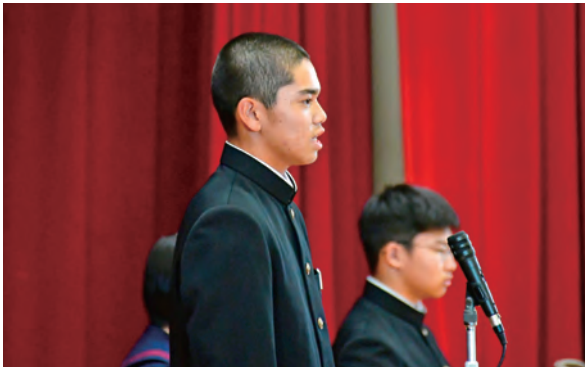
全校生徒に自分の思いを語ります

投票日までの限られた期間、候補者は選挙活動をして自分をアピールします。投票日の10月27日（金）、最後の演説会があり、全校生徒を前に公約を熱心に伝えました。