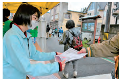
軽トラ市のお手伝いも しました