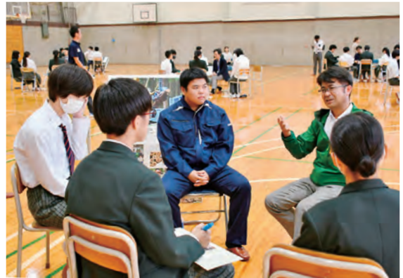
職業人との対話からさまざまな考え方を学びました

(有)フォレストサービス/川上塗装工業(株)/3DSPORTS/ (株)ANA/(医)三和会/リアス観光(株)/(株)みのり片子沢/ 岩手医科大学/ユニバーサルライフ(株) / Restourante Kumagai