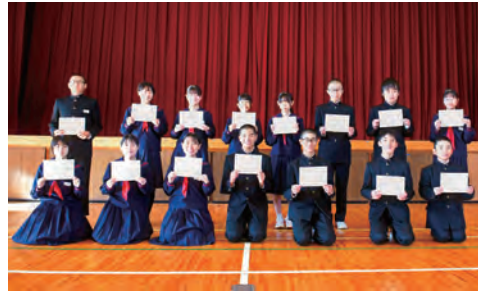
新生徒会の皆さん

今回、しずくちゃん探検隊が訪ねたのは雫石中学校。新しい生徒会役員を決める時期ということで、生徒の代表である生徒会、その会長とはどういう人なのか、生徒会役員選挙にお邪魔してきました。