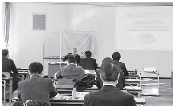
今後の広報編集に生かしていきたい