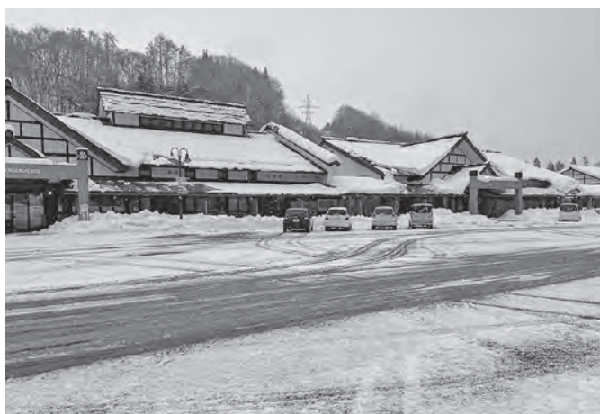
コロナ禍で(株)しずくいしも厳しい経営が続く