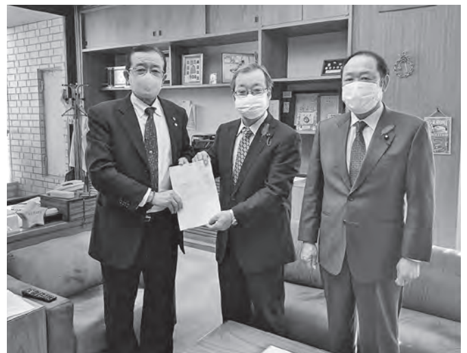
手渡された評価結果と提言