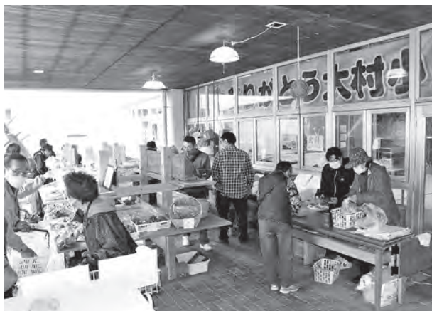
にぎわいの中心となっている旧大村小学校校舎

地域づくり推進課長 旧西根小学校は、文化財保管からスタートし、一部歴史民俗資料館の収蔵資料が既に食堂厨房に保管している。旧上長山小学校は、企業、団体の誘致を想定している。通信環境 Wi-Fi の整備は必須ということで12月定例会の補正予算に上程している。なお、範囲は旧校舎の2階を想定している。