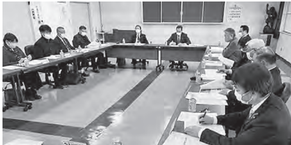
空き家対策や除雪が重要な課題

雫石商工会館において、新型コロナウイルス感染症対策事業、中小企業・小規模事業者振興対策の拡充強化について説明を受け、意見交換等を行いました。