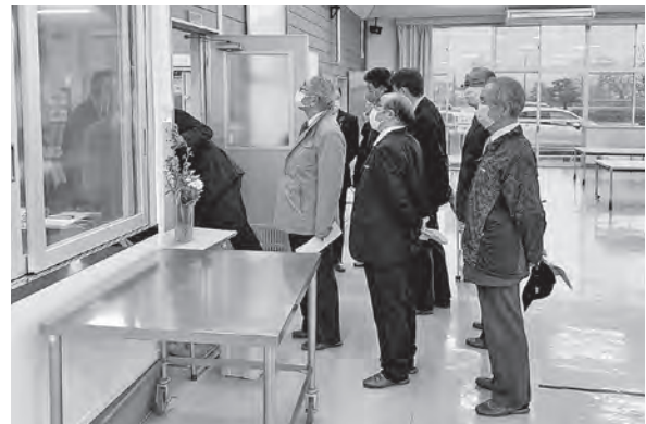
改修された給食室を視察

御明神小学校の大規模改修工事（2期）が完了したので視察してきました。給食棟・中庭・駐車場等の調査では、給食室の厨房に食材回転釜や食器洗い機が導入され、中庭については、ゴムチップで舗装された運動場をサブトラックとして活用していると説明を受けました。