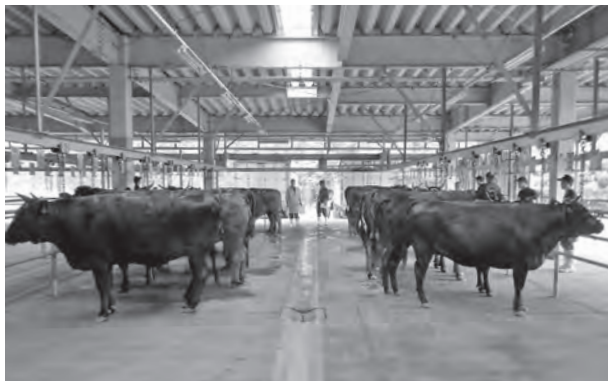
畜産業は町の大事な産業の一つ