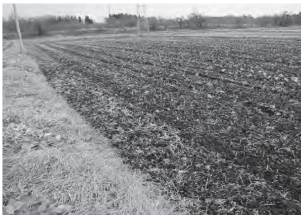
来期に向け、秋耕作業は済んでいる

町長 町地域農業再生協議会の協議を経 て、生産目安を水田面積基準反収等の係数 を用い算定を行い、各農家へ通知を行う予 定。状況に応じて、大規模経営体を中心に 転作誘導等を行いたい。