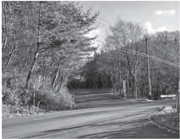
防犯カメラ設置が急務である森のしずく公園入口