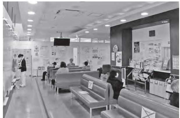
町民一丸で医療体制を守ろう