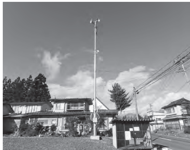
スマートフォンでも確認できる防災無線

町長 屋外拡声子局からの放送では音の伝わる距離、範囲に限界があるので、登録してもらえばスマートフォンなど携帯電話から防災無線の放送内容を受信できるシステムを導入している。