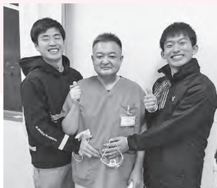
学校で生徒達と (中央筆者)

昭和39年10月生まれ。安庭小学校—雫石中学校—岩手高校—東京経済大学卒業 鍼灸師指導者。東京在住。NSG グループ国際メディカル専門学校講師