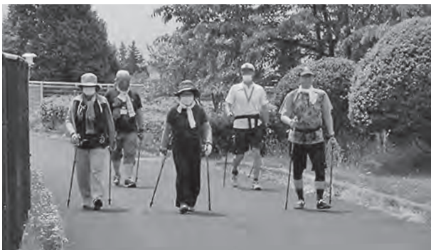
普及拡大を期待するノルディックウォーキング

健康子育て課長 人間ドックを受ける方に費用を一部助成し、今後も受診向上にむけ対応する。また、受診率向上の取り組みとして未受診者には、文書で再通知の連絡や生活習慣病を早期発見するため、自分自身の健康状態をチェックし、自覚症状がなくても年1度健康診査を受けるよう周知啓発する。