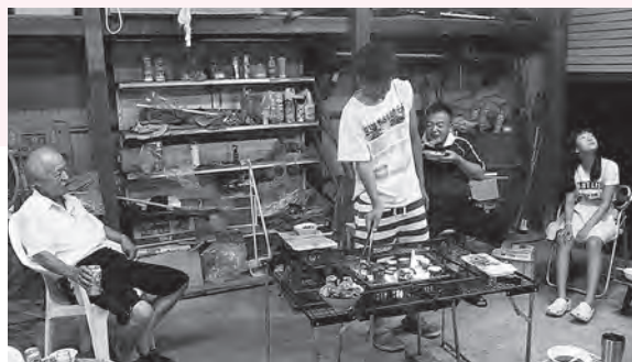
帰省時の家族 BBQ (右から2番目筆者)

コロナ禍の中ですが、皆様にとって本年が、良い年でありますようお願い申し上げます。