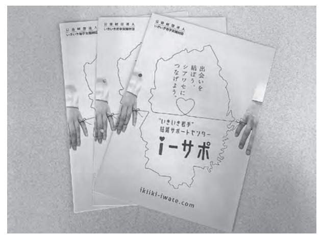
現在は登録料の 5,000 円を助成