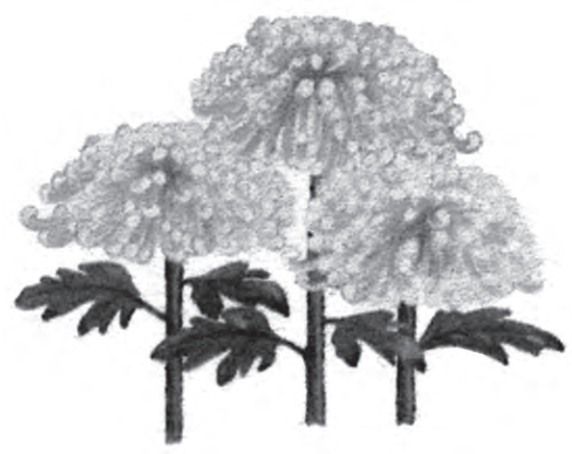
町の花・菊の愛好者がもっと増えてほしい

教育長 現在、会費だけで事業を行うことは困難であるとのことから補助金を交付している。今後も会の活動を通じて、町の花である菊の愛好者が増えるよう、会とともに協議しながら対応していく。