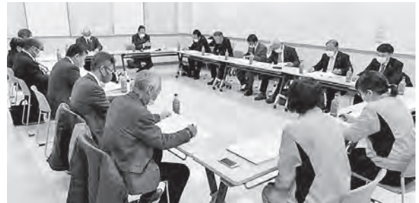
課題は冬場の誘客事業

雫石町観光物産センター交流室において、しずくしい観光協会の取り組みや新型コロナウイルス感染症の影響等について説明を受け、意見交換を行いました。