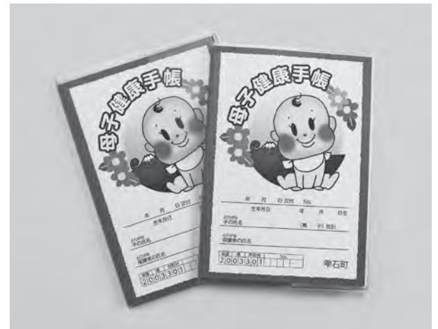
出産祝金も見直しの時期では