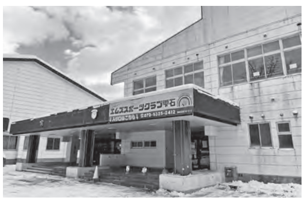
校舎はトランポリン施設などに整備予定

町長 検討を重ねたが、アーチェリーとトランポリンを主とした整備を優先したい。町民には新たな整備までの期間は既存のコースの利用をお願いしたい。