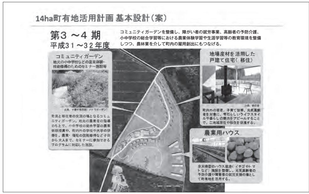
14ヘクタール町有地活用第3期～4期計画