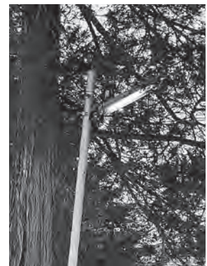
様々な形態・種類の防犯街灯・街路灯