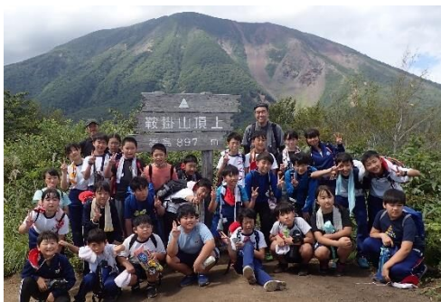
岩手山を背景に記念撮影📷✨