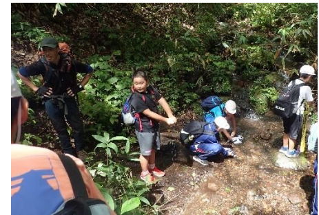
沢の水でタオルを冷やす児童👧