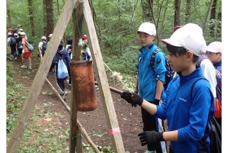
👀と遭いませぬように〜

鞍掛山に自生するオオナンバングセルや珍しいモリアオガエルにも遭遇し、鞍掛山の自然と親しむ機会になりました。