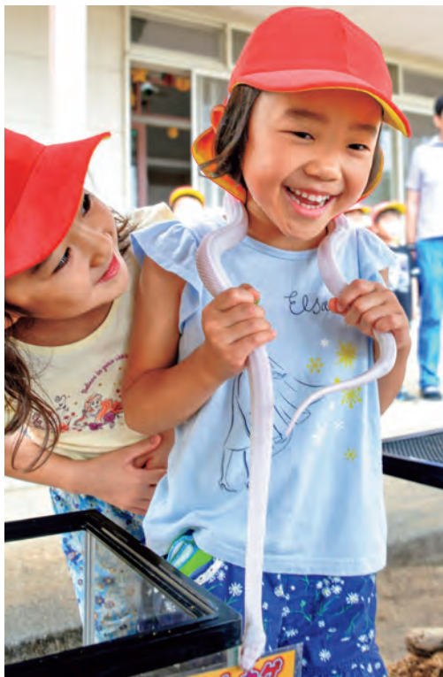
▲首に巻きつくコーンスネークに大興奮!