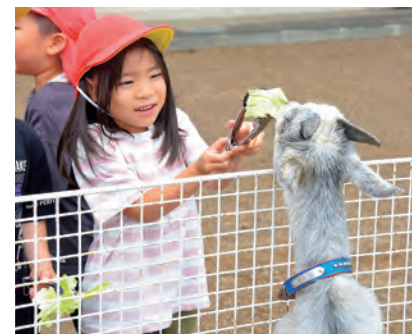
▲上手に餌やりできたかな?