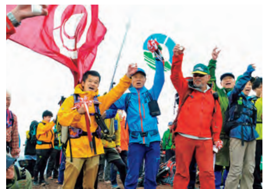
▲山頂で手を高らかに上げ乾杯

山頂では、御神坂・馬返し・焼走りの各コースから登ってきた登山隊とピッケル交換や万歳三唱などが行われ、登頂の喜びを分かち合いました。