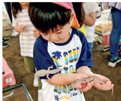
▲トカゲの不思議な触感を楽しみました

園児らはヤギやカメなどに餌を与えてみたり、ヒヨコやトカゲなどを手にのせて動物とのふれあいを満喫。中でもコーンスネークは列をなして並ぶほど大人気で、首にかけてもらった園児は「グネグネして巻き付いてきてかわいい」と笑顔で話していました。