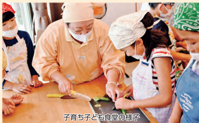
子育ち子ども食堂の様子

①七ツ森小学校体育館 ②御明神公民館 ③西山小学校体育館 ④まちおこしセンターしずく×CAN ⑤御所公民館 ※いずれか1回の参加も可能です。