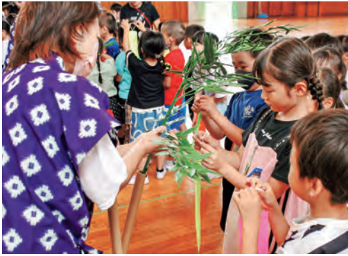
▲願いをのせた短冊をくくりつける児童たち