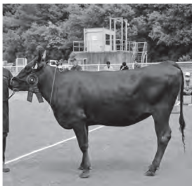
▲見事名誉賞に輝いた「ひよ号」