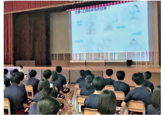
▲真剣に講演を聞く生徒たち