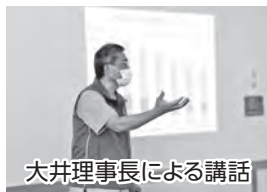
大井理事長による講話

健康講話ではシルバリーハビリ体操体験も実施。「通いの場」の参加者のほか、老人クラブ