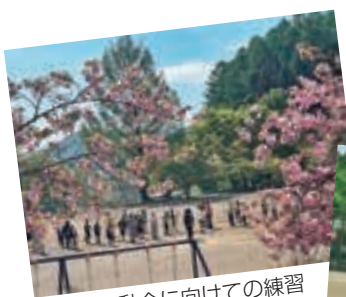
運動会に向けての練習

七ツ森小学校の金管バンドの伝統はまだまだ続いていきます。これからも応援よろしくをお願いします。