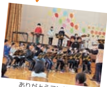
ありがとうコンサート