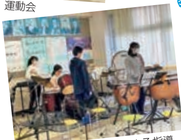
高校生ボランティアによる指導