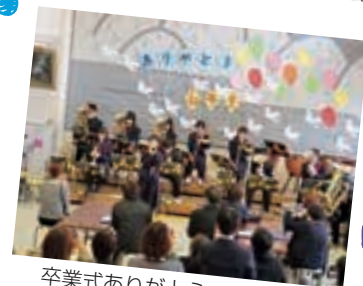
卒業式ありがとうコンサート