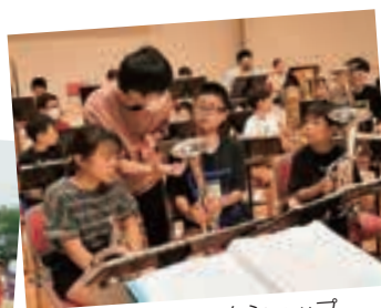
東京藝大ワークショップ