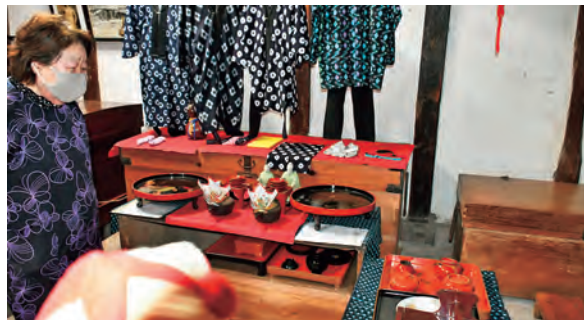
地域の婚礼で使用された食器や小物

ご親戚や知人の力を借りながら、整えたというこちらの展示室。当初、蔵を整理する際、民具は全て処分するつもりだったそうですが「現代では作れない貴重な物」という知人の言葉を受け、考え直すことに。今は、近所のお友達と集まって、ほっと一息つく憩いの空間になりました。