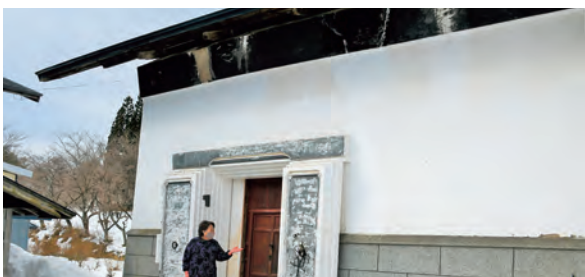
築100年以上のお蔵です

そんな「しらかば」さんのお蔵に、郷土の民具を展示するコーナーが出来たということで、民具に関心のあるしずくちゃんは、早速お邪魔してきました。