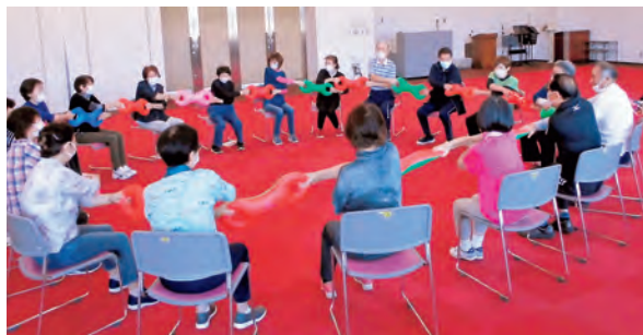
3B 体操で楽しみながらリフレッシュ

シニア世代の仲間づくり、心身の健康づくりをテーマに、年間10回の教室を開催し、工芸品の制作、歴史の学習、軽体操や、登山など、様々な分野を体験し、楽しんでいます。