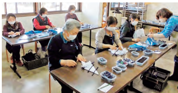
この日は藍染体験を行いました