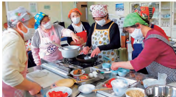
食生活改善推進員の指導で学びます