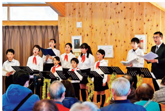
クリスマスに大好きな歌をプレゼント

12月25日(日)、七ツ森地域交流センターで第7回しずくいし少年少女合唱教室発表会を開催し、今年練習した曲の中から、受講生が選んだ大好きな曲が披露されました。賛助出演として、OBの中高生や保護者も加わり、アットホームなひとときとなりました。