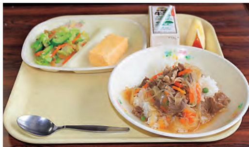
雫石小学校メニュー「雫石牛牛丼」

JA 全農いわて「いわて牛・いわて短角牛学校給食の日」の取組みの一環として、11月29日「いい肉の日」に、町内各小中学校で、いわて雫石牛を使用した給食が提供されました。雫石小学校では雫石牛牛丼、七ツ森・西山・御明神・御所小学校では雫石牛ビビンバ、雫石中学校は和牛すきやき風煮が提供され、児童生徒は美味しい給食を通して、地元の食材について学びました。