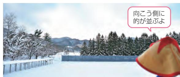
2階観客席からの眺望は抜群

2階は、観客席となっています。大会などが行われる際には、150人を収容することができます。