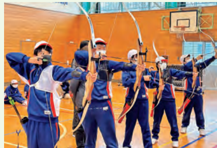
西山小学校6年生の皆さん