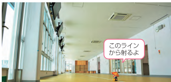
1階練習場。窓の外70m先を狙います

今回は、特別に内部を見せてもらえるということで、皆様にご報告するべく早速お邪魔してきました。