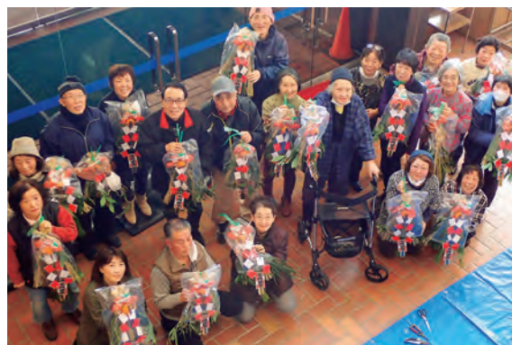
各々の作品を手にする皆さん

受講生は、慣れない縄ない作業に四苦八苦しながらも、各自見事に完成させ持ち帰りました。出来栄えに思わず笑みがこぼれました。