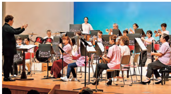
今年の発表会も頑張りました

週に1回の練習で、小学生から80代まで多世代の仲間が集い、さまざまな楽曲にチャレンジしています。年に1度の発表会も実施し、練習の成果を皆さんに聴いていただいています。