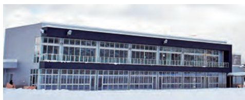
いわて雫石アーチェリーセンター

【名称】いわて雫石アーチェリーセンター 【オープン】令和5年4月予定 【見どころ】屋内射場としては日本最大級の施設 建設地の旧南畑小学校校庭は、風が弱いという特徴から過去には女子の日本記録が生まれた