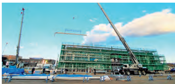
工事の様子（11月2日撮影）

来春オープン予定の「いわて雫石アーチェリーセンター」は、2016年いわて国体のアーチェリー競技が雫石町で開催されたことを契機に、「アーチェリーのまちしずくいし」を目指し、建設されている施設です。