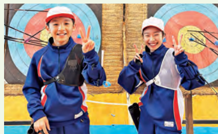
西山小学校5年生の皆さん

短い時間でしたが、授業を通してたくさんの児童にアーチェリーがどんなスポーツなのか知ってもらえたことは大きな一歩だったと思います。楽しんでいる様子を見て、より多くの町民の方々にアーチェリーに興味を持っていただけるよう、これからも頑張ってお知らせし、気持ちを新たにしました。来年もどうぞ応援よろしくお願いたします！