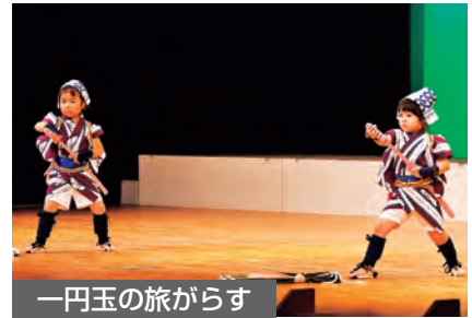
一円玉の旅がらす