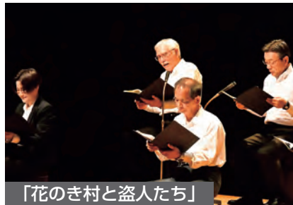
「花のき村と盗人たち」