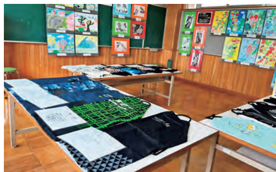
御明神小学校児童の作品が並ぶ会場

11月5日(土)～11月6日(日)の2日間、旧橋場小学校で「橋場の文化祭(主催:旧橋場小学校さおでんせ会)」が開催されました。同イベントは地域交流のきっかけにしようと開催され、橋場地区の皆さんの作品とともに、御明神小学校児童の作品が展示されました。習字やエプロンなどの裁縫作品や思い出の校舎をテーマにした絵などが並び、会場を彩りました。