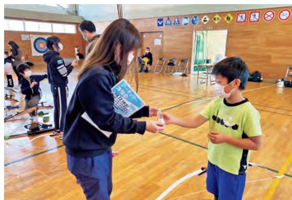
矢の形をしたペンをもらう参加者

11月19日(土)、アーチェリーの普及活動の一つとして、旧西根小学校体育館で、第6回アーチェリー体験会を開催しました。町内外から延べ29人参加し、アーチェリーを楽しみました。この日は体験会5回参加で挑戦できるチャレンジゲームに参加した方もおり、見事高得点を獲得し、景品の矢ペンをゲットしました。参加者へのインタビューの様子を「アーチェリーって楽しい!」のコーナーで紹介しています。