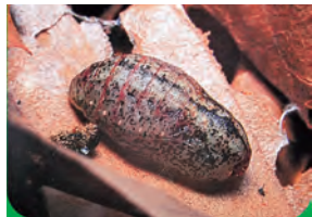
羽化の時を待つサナギ

4月下旬、冬を越した卵がふ化します。幼虫は、デワノトネリコという樹木の葉を食べながら大きくなり、6月中旬、トネリコの樹を降りて石の下や落ち葉の下でサナギになります。6月下旬から7月上旬にかけて羽化し、蝶となって私たちに姿を見せてくれます。羽化したチョウセンアカシジミは、それから3週間以内に、交尾・産卵をして