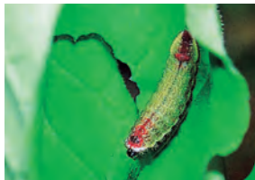
トネリコの葉を食べる幼虫

チョウセンアカシジミは羽を広げた大きさが約3.5cmの小型の蝶。綺麗なオレンジ色の羽と、白黒のボーダー柄の足を持っています。日本では、岩手県や山形県、新潟県のごく一部にしか生息していない希少な蝶です。