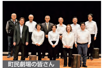
町民劇場の皆さん