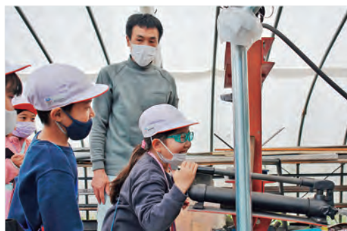
清水機械工業で機械を触ってみる児童

9月28日(水)~10月11日(火)、七ツ森小学校2年生12人は総合学習で学区内の企業を訪れました。創作陶器の十喜工房、ローソン七ツ森店、岩手日産自動車(株)雫石店、盛岡セイコー工業(株)、