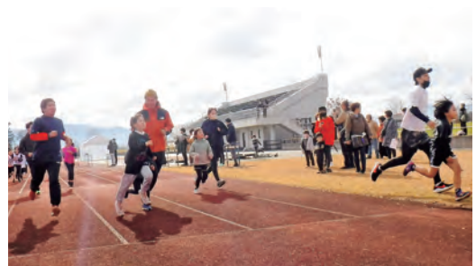
親子で駆け抜けるファミリーミニマラソン

引き続き、例年5月に開催されていた岩手山ろくファミリーマラソンの代替イベント「ファミリーミニマラソン」が開催され、ペアの部26組53人と個人の部20人が参加し、親子で爽やかな汗を流しました。