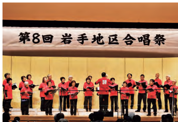
「世界の約束」「花は咲く」を披露する皆さん

合唱祭終了後、参加者は「次回合唱祭に備えてしっかり練習したい」と来年に向けて意気込みました。