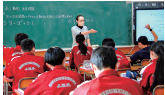
数学の授業で発言する生徒

雫石中学校で、中高連携の取組の一環として雫石高校の教員による出前授業が行われました。3年2組は数学の授業を受け、授業体験以外にも、中学校の教科書が高校の授業理解に役立つこと、中高の学習は将来の就職試験まで繋がっていることなど、教員の話を中心に聞きました。