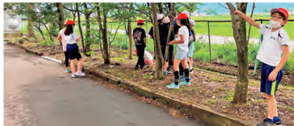
長年、観察会を行っている御明神小学校

チョウセンアカシジミの生息地となるトネリコの木は、かつては水田の畔に植えられ稲のはせ掛けに使われ、町内にも多く自生していました。しかし、農業の機械化や土地開発など、人の生活環境の変化と共に減少。生息地の消失により、チョウセンアカシジミも姿を消し始めました。更には、採集者による乱獲もあり、絶滅の危機が増大している種として、環境省のレッドデータブックや岩手県レッドデータブックに登録されています。