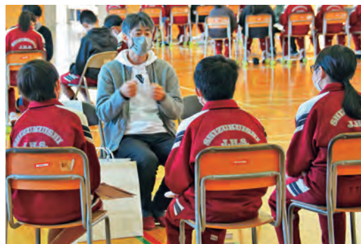
積極的に企業の方と交流する生徒

2日間それぞれ町内外の企業や個人事業主の方など、のべ45ブースが体育館に集まり、生徒たちは、企業の方から「働くということ」「働くことのやりがい」などの話を聞き、仕事に対する学びを深めました。