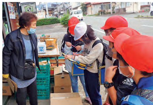
10/7 よしゃれ通り方面

大定商店や永昌寺をはじめとするさまざまな場所で地域の方から話を聞く児童たち。雫石町ならではのマンホールなど、児童たちがお宝と思うものも写真に収めて歩きました。