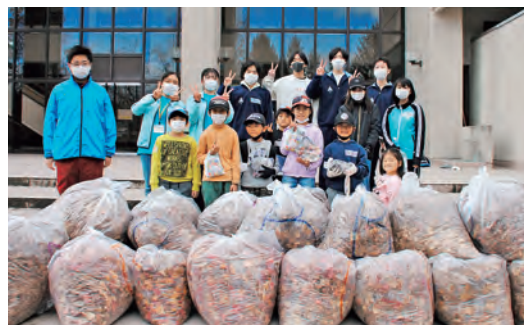
たくさん集めました！

町内の小学生～高校生13人が参加し、3チームに分かれて落ち葉やゴミを拾いました。優勝チームが集めた重さは31キロ。3チームで約80キロの落ち葉とゴミを拾いました。