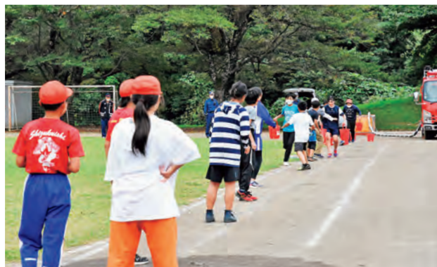
6年生も協力して頑張りました