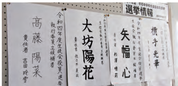
生徒玄関に掲示されるポスター

投票日までの限られた期間、候補者は朝の活動と昼の放送で自分をアピールします。投票日の10月28日（金）、最後の演説会がありました。全校生徒を前に、公約を熱心に伝えました。