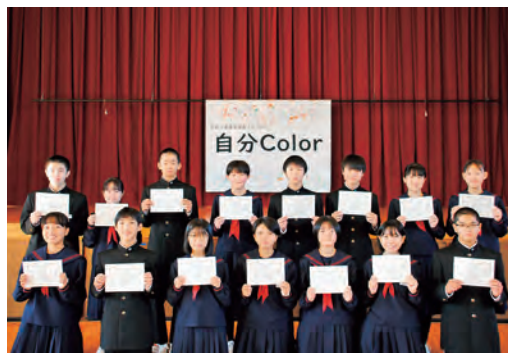
新生徒会役員の皆さん

今回、しずくちゃん探検隊が訪ねたのは雫石中学校。新しい生徒会役員を決める時期ということで、生徒の代表である生徒会役員、その会長はどういう人なのか、生徒会役員選挙から認証式まで密着してきました。