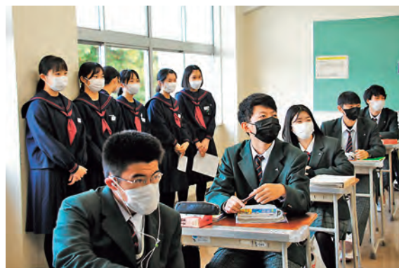
英語の授業を熱心に見学

10月19日（水）、雫石中学校3年生を対象に雫石高校見学会が開催されました。3年4組は5時間目（13：45～14：35）の授業を見学し、高校1年生から3年生までの各教室を自由に見て回りました。この取組は、中学3年生が進路を決めるにあたり、地元高校の見学を通して、高校はどんな場所かという理解を深めることを目的に開催されています。