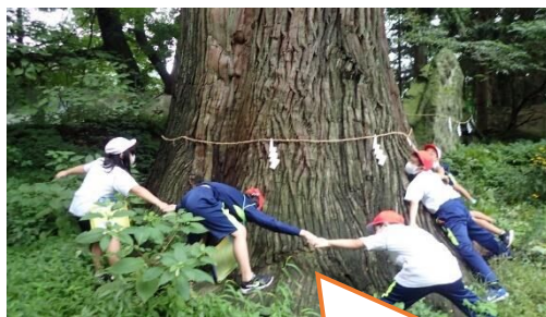
手をはなさないで～っ！！