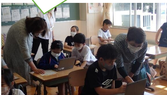
「ん」は「nn」って入力するんだよ！

9月30日（金）、西山小学校3年生（21名）は外国語学習の中でタブレットを使用した学習を行いました。この日は西山公民館事業、シニアスマートホン教室の受講生3名がボランティアとして補助に入ってくださいました。児童がPC操作につまずいたとき、操作のやり方を教えて下さったり、一緒に悩んだり、ローマ字入力を