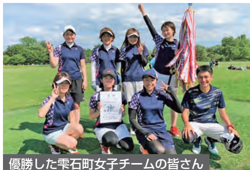
優勝した雫石町女子チームの皆さん

北上市和賀川グリーンパークテニスコートにおいて開催された県民体育大会ソフトテニス競技町村対抗の部で雫石町が見事1位に輝きました。奥州市前沢区との決勝戦を2-1で制し、4年ぶり8回目の優勝を果たしました。