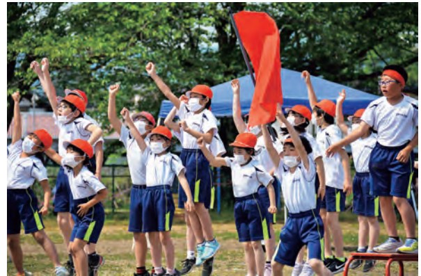
応援にも熱が入ります

運動会が終わり、休む間もなく零石町小学校陸上記録会に向けて、練習が始まりました。朝のリレー練習、放課後の全体・種目別練習と、全職員が一丸となって児童の指導に当たりました。特に、リレーの出場選手たちは、陸上記録会担当の先生から「リレー選手の君たちは、御明神小学校の代表選手の中でも中心的な存在」と、話をされ気合いが入っていました。全体練習がない日でも、上手にバトンをつなぐため、自主練習に励んでいました。当日は、それぞれの自己ベストに向けて、練習してきた成果を本番でしっかり発揮することができました。