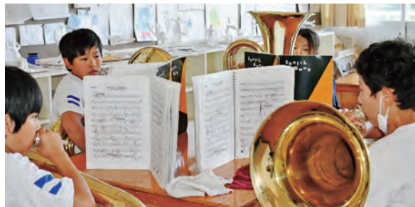
パート練習も基礎練習からしっかり

今回の東京藝大との初コラボについて尋ねると「子どもたちは、東京から来るプロになる人たちに、たくさん教えてもらえる！」と大喜び。一緒に演奏が出来ることを楽しみにしていて、練習にも熱が入っていますよ」と普段の様子を話してくれました。