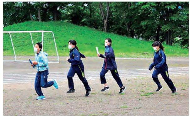
4人で呼吸を合わせます