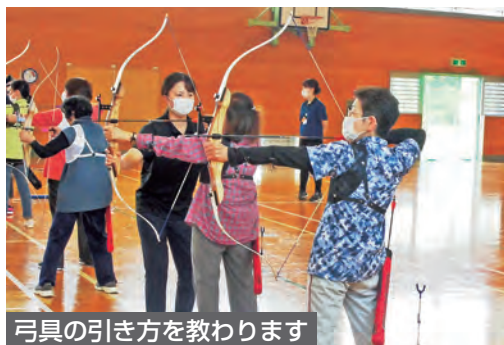
弓具の引き方を教わります

弓具の引き方やフォームを教わり、実際に射ってみた参加者は「思ったよりも汗をかくし良い運動!」「とても楽しかった!」と楽しんでアーチェリーを体験しました。