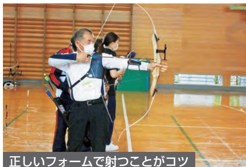
正しいフォームで射つことがコツ