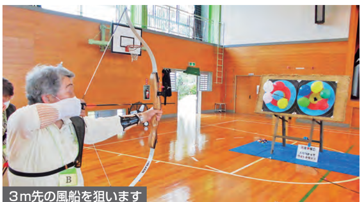
3m先の風船を狙います