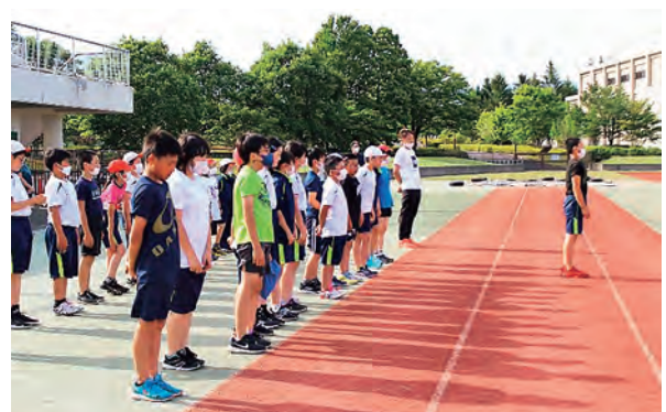
競技場に向かって、しっかり挨拶