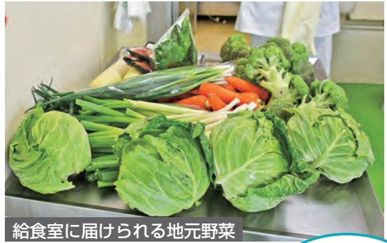
給食室に届けられる地元野菜

その中で、児童生徒の肥満予防・改善をはかるため、毎月よくかむことを意識した「カミカミ給食の日」というものがあります。