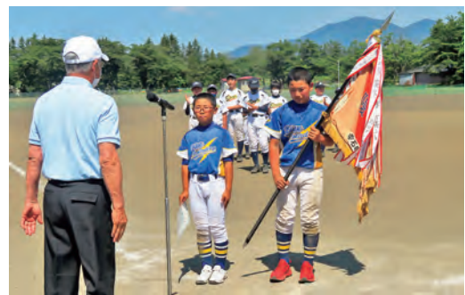
優勝した御所ブルーサンダース