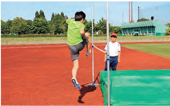
自己ベストを目指して、跳ぶ！

運動会が終わり、休む間もなく零石町小学校陸上記録会に向けて、練習が始まりました。朝のリレー練習、放課後の全体・種目別練習と、全職員が一丸となって児童の指導に当たりました。特に、リレーの出場選手たちは、陸上記録会担当の先生から「リレー選手の君たちは、御明神小学校の代表選手の中でも中心的な存在」と、話をされ気合いが入っていました。全体練習がない日でも、上手にバトンをつなぐため、自主練習に励んでいました。当日は、それぞれの自己ベストに向けて、練習してきた成果を本番でしっかり発揮することができました。