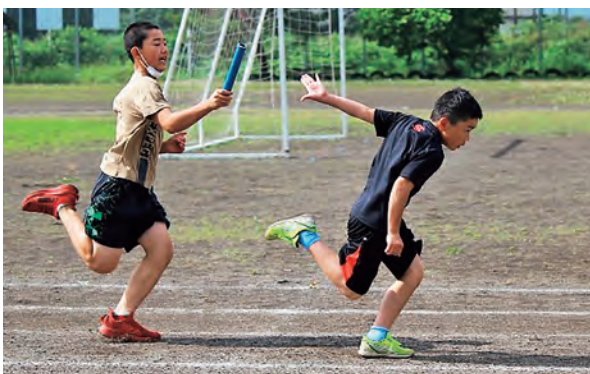
バトンを渡すタイミングを調整