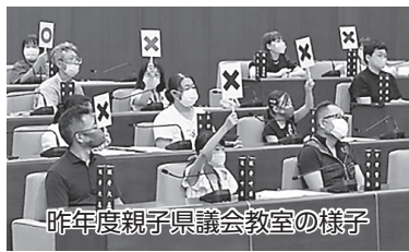
昨年度親子県議会教室の様子