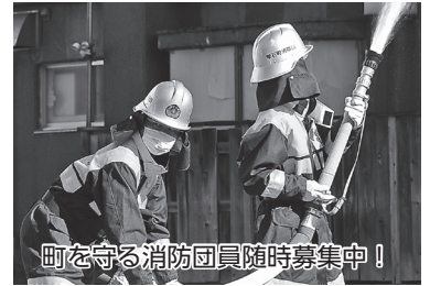
町を守る消防団員随時募集中！