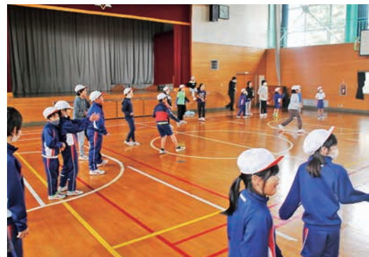
西山っ子フェスタで盛り上がる

昨年度の学校運営協議会で、今後の地域学校協働活動として「にしやま大運動会」を再び行おうという提案が出されました。コロナ禍前の学校統合の年に始まった学校と地区民の合同運動会です。にしやま大運動会実行委員会の3月に行われた会議では、西山小学校の「地域とともに」という学校の理念と実行委員会の「世代間交流」という目的の両方を叶えるイベントとして是非連携して取り組んでいきたいという考えを共有しました。今年度は、小学校の運動会のプログラムの一部を地域企画で実施することになりました。学団で取り組む競技を地域（実行委員会）で考え実施する方向で動いています。どんな種目になるのか、楽しみです。