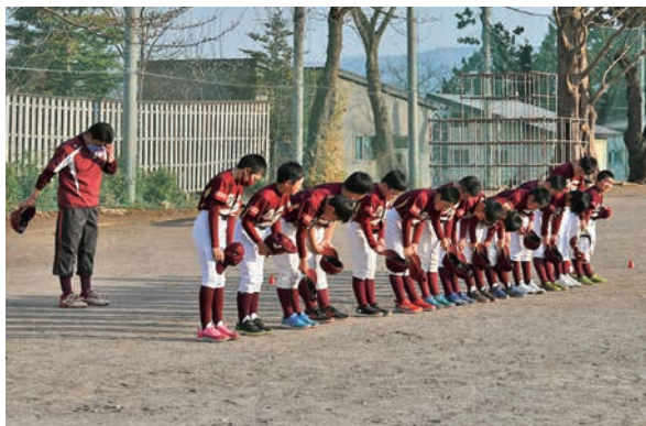
まずはみんなでグラウンドにあいさつ

この日の練習場所は雫石小学校校庭。ランニングや体操、アップ、ノックなど元気な声が響きます。