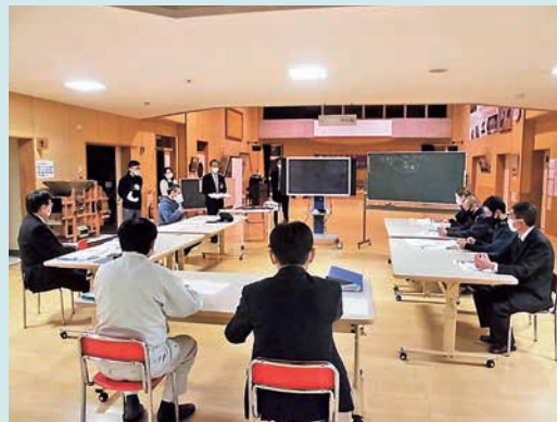
御所小学校学校運営協議会の様子

1年目の活動で、まだまだ道半ばですが各学校の1年間の取り組みを「雫石町コミュニティ・スクール実践報告集」としてまとめました。町立図書館もしくは町教育委員会で閲覧できますので、お気軽にお問合せください。