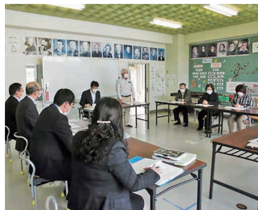
にしやま大運動会に向けて

昨年度の学校運営協議会で、今後の地域学校協働活動として「にしやま大運動会」を再び行おうという提案が出されました。コロナ禍前の学校統合の年に始まった学校と地区民の合同運動会です。にしやま大運動会実行委員会の3月に行われた会議では、西山小学校の「地域とともに」という学校の理念と実行委員会の「世代間交流」という目的の両方を叶えるイベントとして是非連携して取り組んでいきたいという考えを共有しました。今年度は、小学校の運動会のプログラムの一部を地域企画で実施することになりました。学団で取り組む競技を地域（実行委員会）で考え実施する方向で動いています。どんな種目になるのか、楽しみです。