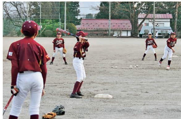
真剣にトスバッティング練習

「今年の目標は、県大会ベスト8。去年はベスト16だったので、守備を大事にしてリズムをつくっていきたい」と、まずは5月に開催される県大会予選を見据えます。