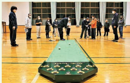
スカットボール (西山)

町スポーツ推進委員を講師に、輪投げやスカットボール、ニチレクボール、ドッチビー、キンボールの5種目を町民が体験しました。参加者からは「大人も子どもも楽しめて良かった」「他のニュースポーツもやってみたい」などの声が聞かれ、老若男女問わず楽しめるニュースポーツの可能性を感じました。