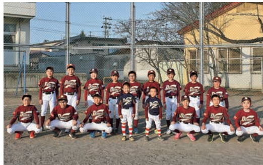
雫石ダイナミックスの皆さん

今回しずくちゃん探検隊が潜入したのは、「雫石ダイナミックス野球スポーツ少年団」。雫石小と七ツ森小、御明神小の1～6年生が活動するチームです。町内に21あるスポーツ少年団(R3.3.31現在)の中でも、令和4年度の活動をいち早く始めた団体ということで練習へお邪魔することにしました。