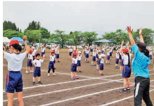
やってみよう体操

学年を超えた縦割り班活動も活発で、縦割り班で掃除や遊びに取り組んでいます。昨年度は、班ごとの団結を強めるために、新たに各班の旗を作りました。給食をランチボックスに詰めてもらい、縦割り班で仲良く一緒に給食を食べる機会を2回つくることができました。11月には、児童会執行部が企画して、全校レクレーション「西山っ子フェスタ」を行い、縦割り班ごとに、10か所位を巡り、いろいろなゲームに挑戦しました。子どもたちがとび切りの笑顔を見せる時です。