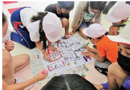
班の旗をつくろう