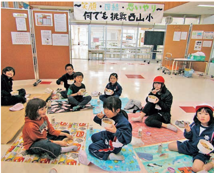
ランチボックスで楽しい給食