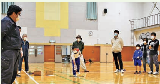
ニチレクボール (御所)