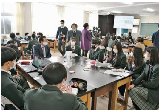
2/14に開催された虹色コンパス報告会

令和3年度に開催された報告会では、インターンシップでの課題や成果が発表され、生徒はより学びを深めました。今後も、地域で活躍する人材や地域の人たちとの交流の中で学びを深める虹色コンパスの活動は続いています。