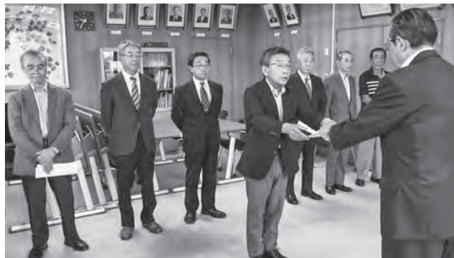
辞令書を受け取る管理委員

町は、御明神の約2229ヘクタール区域に係る御明神財産区管理委員に、議会の同意を得て次の通り7人を選任しました。任期は2027年7月30日までの4年間です。