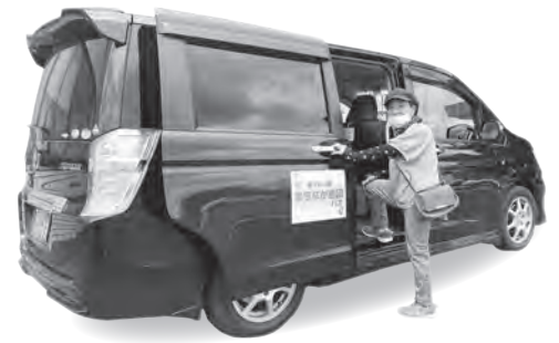
▲まちなか巡回バスはホンダステップワゴン(黒)