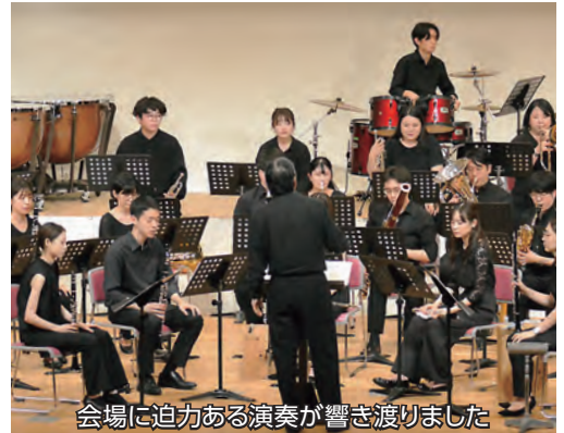
会場に迫力ある演奏が響き渡りました

29日に小岩井農場まきば園でのミニコンサート、30日に野菊ホールでメインコンサートを実施。メインコンサートでは、優しさと力強さを兼ね備えた演奏から、七ツ森小学校金管バンドとのコラボ演奏、野菜を使った楽器作りコーナーといった演出で来場者を楽しませました。