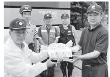
町内商業施設に交通安全啓発資材を設置いただきました

町内商業施設にご協力いただき、自由に持ち帰ることができると啓発メッセージ入りのミニうちわとウェットティッシュを設置し、各施設を利用する運転手へ啓発を行いました。