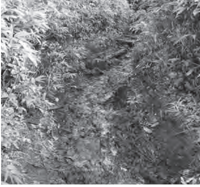
表土が崩れ雨水が溜まり泥濘化した登山道