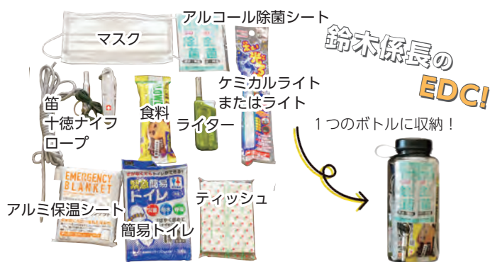
※ Everyday Carryの略。「常に持ち歩く物(常時携帯備品)」の意味。

私が用意しているEDCは左の画像の通りです。そのほとんどが100円ショップで用意できるものです。EDCを用意し、平時から防災意識を持ちましょう。