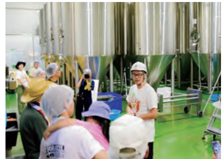
ビールが作られる工程を教わります