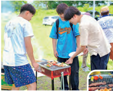
栗石牛南部かしわのBBQ ▶

「国道46号ゆるゆるアウトドア観光推進研究会」は、さまざまな講演や体験を通し、町の新たなアウトドアコンテンツを探る取り組みを行なっています。☎観光商工課 ☎692-6407