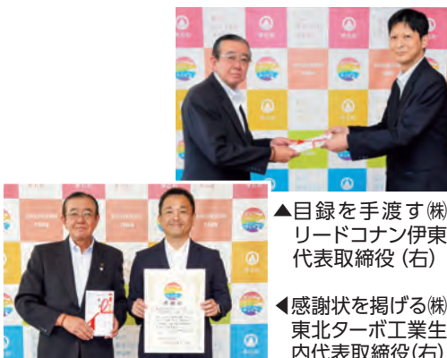
▲目録を手渡す(株)リードコナン伊東代表取締役(右)