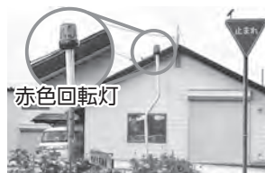
防犯交通安全施設設置地点は特に事故に注意

また、通学路や住宅街ではスピードを控えるとともに、常に子どもの飛び出しに注意しましょう。