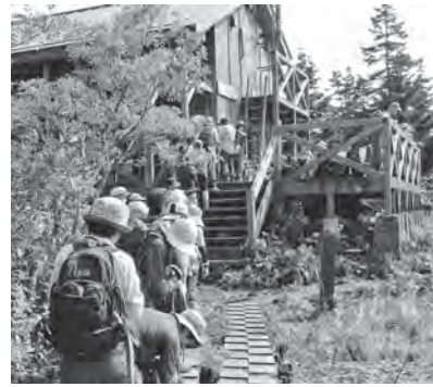
ハイシーズンの混雑する三ツ石山荘