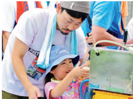
キンキンに冷えたビールをジョッキへ!