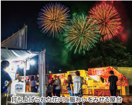
打ち上げられた花火と賑わいをみせる屋台