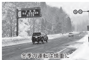
冬季の運転は慎重に