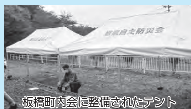
板橋町内会に整備されたテント

2022年度は、板橋町内会の事業が採択され、テント2張りが宝くじの助成金で整備されました。自主防災活動やコミュニティ活動など多目的に活用されます。