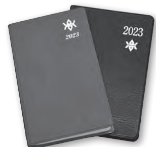
岩手県民手帳(左)と岩手県能率手帳(右)