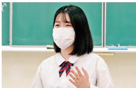
▲笑顔で話す語り口が充実した学校生活を物語ります