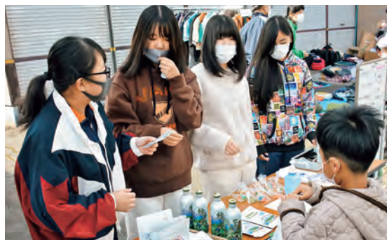
▲「虹色コンパス」で出店した軽トラ市で来客対応する愛沙さん（左から3人目）

進学先は、日本外国語専門学校総合英語科。実はもともと英語は苦手科目。何がわからないかわからない状態だったといいます。