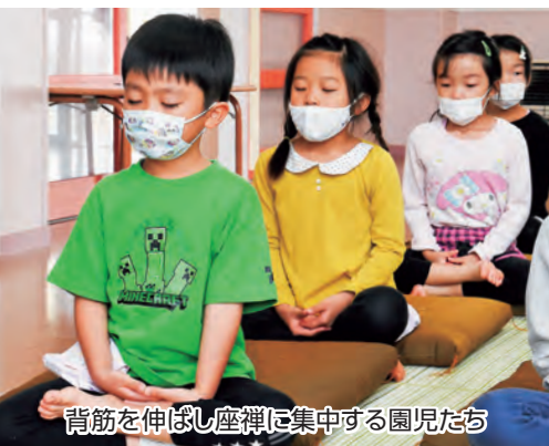
背筋を伸ばし座禅に集中する園児たち