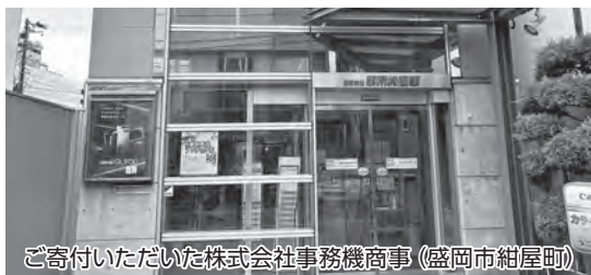
ご寄付いただいた株式会社事務機商事（盛岡市紺屋町）

いただいたご寄付は、雫石町まち・ひと・しごと創生総合戦略「いきいきと仕事のできるまちづくり事業」に関する2022年度事業の経費に充て、役立てさせていただきます。誠にありがとうございます。