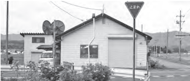
▲入り組んだ交差点に設置される赤色回転灯(まがき行政区)

※限られた予算での設置となるため、必ずしも要望箇所に設置されるとは限りません。その場合は、次年度に再度要望書の提出が必要となります。