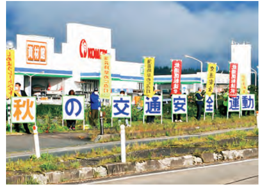
▲のぼりを掲げ交通安全を訴えました(栗石バイパス)

早朝の肌寒い中、防犯交通安全協会役員や老人クラブ、PTA会長、町議会議員など約150人が、国道46号栗石バイパスや町道の沿道に立ち「しめようシートベルト」「飲酒運転追放」などののぼり旗を持って、ドライバーに交通安全を呼びかけました。