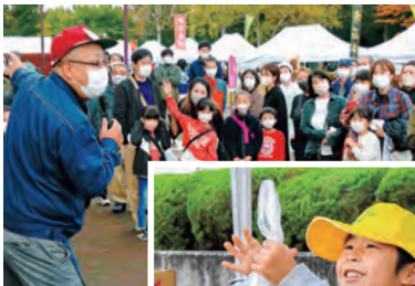
かわいらしい笑顔で産直野菜を販売