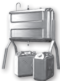
給油中のちょっとした不注意が大きな事故の原因に