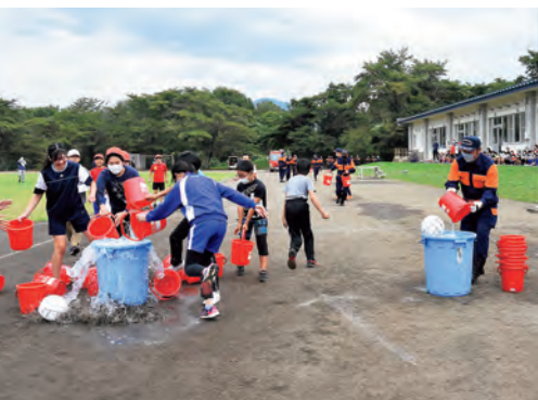
▲児童と消防団員によるバケツリレー対決