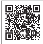
▲いわて子育て世帯臨時特別支援金について