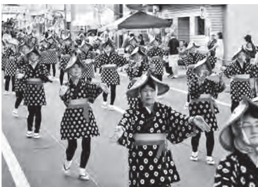
雫石の真夏を彩るよしやれパレード