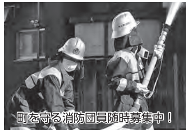
町を守る消防団員随時募集中！