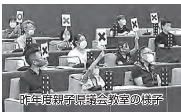
昨年度親子県議会教室の様子