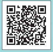
虹色コンパスの様子は町公式 Youtube でチェック!