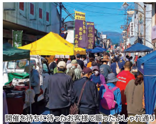
開催を待ちに待ったお客様で賑ったよしゃれ通り

当日は天候にも恵まれ、開催を待ちに待った約4,900人のお客様が、通りに並び約50台の軽トラの荷台に積まれた野菜やキノコといった秋の味覚や惣菜、加工品などのお目当ての商品を買い求めていました。