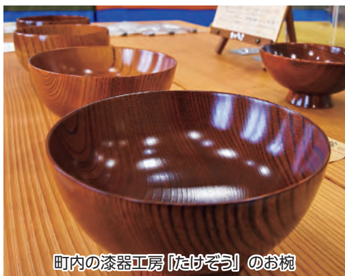
町内の漆器工房「たけぞう」のお椀