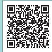
雫高虹色コンパス 公式 Facebook