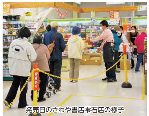
発売日のさわや書店雫石店の様子

クーポン券のお得感と雫石町の魅力が相まって発売前から注目を集め、県内の書店やコンビニで当日発売分の10,000冊が午前中ではほぼ完売。町内唯一の販売書店となったさわや書店雫石店でも、開店前からパスポートを買い求める人たちの長蛇の列ができていました。