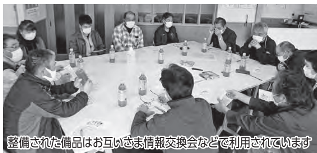
整備された備品はお互いさま情報交換会などで利用されています

今年度は中島自治会の事業が採択となり、テーブル22台、椅子72脚が宝くじの助成金で整備され、中島地域公民館を拠点とした地域の各種行事や会合などで活用されています。こうした助成事業により、地域のコミュニティ活動の充実・強化が図られ、地域社会の健全な発展と住民福祉の向上が期待されます。