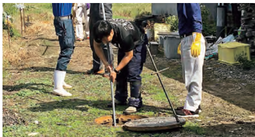
詰まった紙類の除去作業に対応する職員