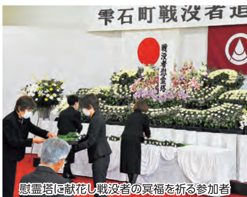
慰霊塔に献花し戦没者の冥福を祈る参加者