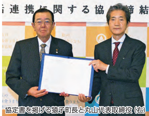
協定書を掲げる猿子町長と丸山代表取締役(右)