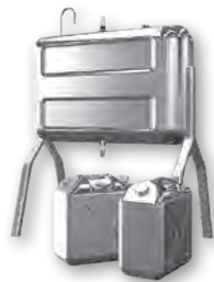
給油中のちょっとした不注意が大きな事故の原因に