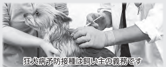
狂犬病予防接種は飼い主の義務です