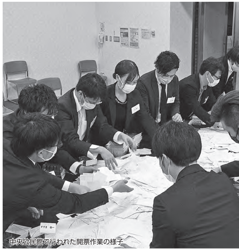
中央公民館で行われた開票作業の様子