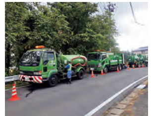
清掃車両3台を作業に要しました