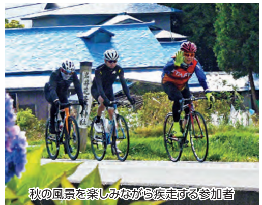
秋の風景を楽しみながら疾走する参加者

当日は各地から集まった最年少7歳から最高齢73歳までの195人がエントリー。参加者は爽やかな秋晴れのもと、町の豊かな自然が織りなす紅葉の景色を楽しみつつ、各所に設置されたエイドステーションで振る舞われた牛丼やお餅、舞茸汁、ゼラートなどでお腹を満たしながら、それぞれの体力に合わせたペースで完走を目指し町内を走り抜けました。