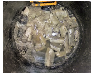
下水道管内に冷えて固まり堆積した油脂類

この状況を改善するため、業者に清掃作業を委託し、およそ70万円の支出を要しました。