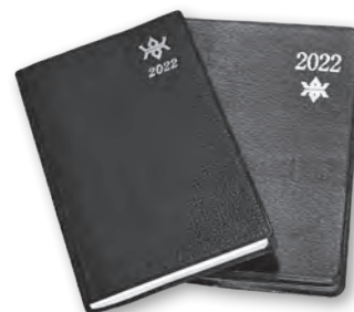
岩手県民手帳(左)と岩手県能率手帳(右)