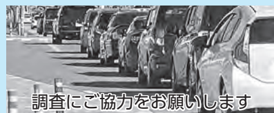
調査にご協力をお願いします

📞 自動車起終点調査サポートセンター ☎ 0120-105-606 (日曜・祝日を除く9時~18時)