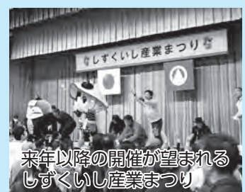
来年以降の開催が望まれるしずくいし産業まつり