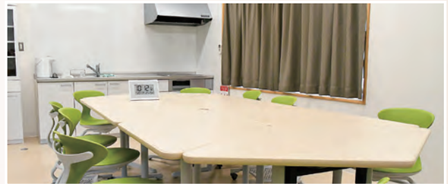
多目的スペース▶ 10名程度の会議や、ワーキングスペース、講座の開催など気軽に自由に使用できる部屋。キッチン (IH) 設備がある。