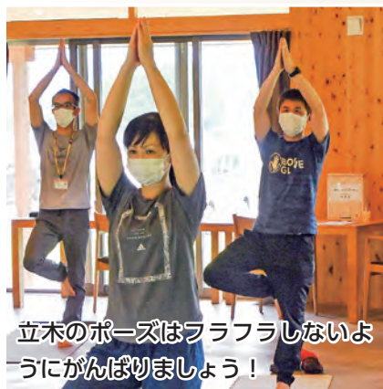
立木のポーズはフラフラしないようにがんばりましょう！