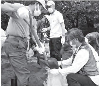
▲昨年の水防工法訓練(土のう作成)