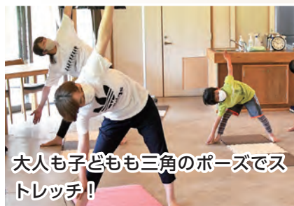
大人も子どもも三角のポーズでストレッチ！