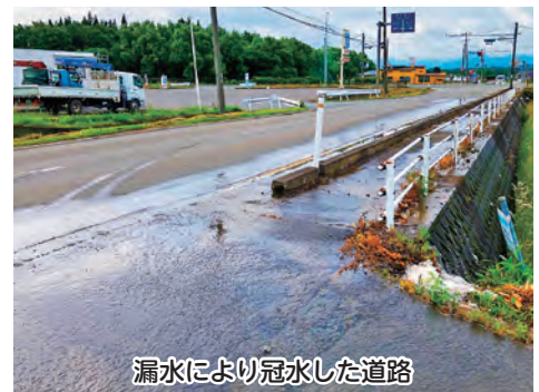
漏水により冠水した道路

水道は日常生活に欠かせないライフライン。食事や入浴、衛生管理のみならず、農業や業務に使用する人も多くいます。1分でも早く水道を復旧しようと関係者が一丸となって対応し、破裂した箇所の配水管を新しいものに交換。その結果、その日のうちに断水は解消しました。