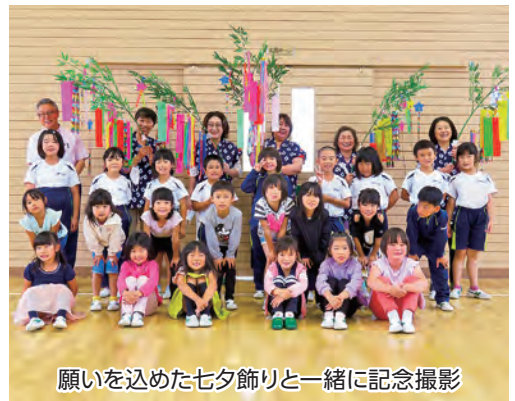
願いを込めた七夕飾りと一緒に記念撮影

この事業は商店街のにぎわい創出と子どもたちの健やかな成長などを願い同部が毎年実施しているもので、制作された七夕飾りは11日までよしやれ通り商店街に飾られ、商店街を華やかに彩りました。