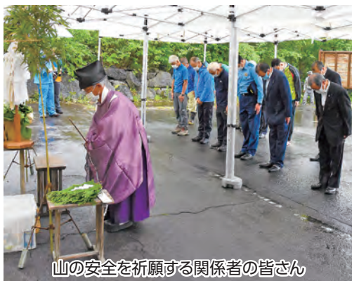
山の安全を祈願する関係者の皆さん