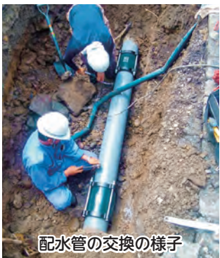
配水管の交換の様子