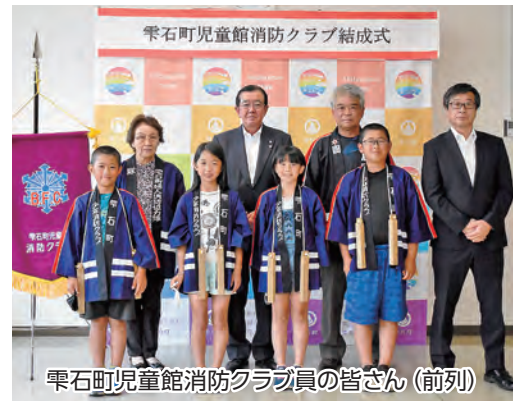
雫石町児童館消防クラブ員の皆さん(前列)

今後、クラブ員たちは、防火ポスターの作成や研修視察、火の用心の活動などを通じて防火や防災についての理解を深め、将来的に地域貢献ができる人材となるよう取り組んでいきます。