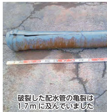
破裂した配水管の亀裂は1.7mに及んでいました