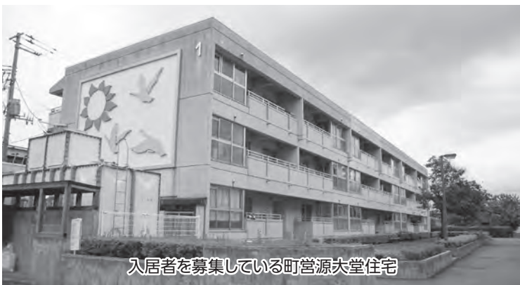
入居者を募集している町営源大堂住宅