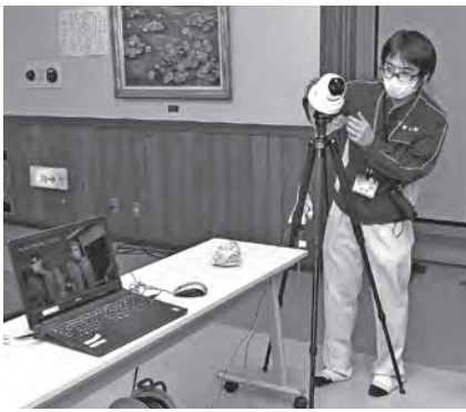
▲昨年から始まったサーマルカメラの設置

【注意】避難指示などの発令訓練に関して、御明神地区に防災行政無線を用いて避難指示の放送をします。その他、情報伝達をより確実なものとするため、モバイルメール、エリアメール、町のツイッターによる配信や町のホームページへの掲載も行います。