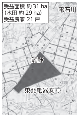
▲籬野地区ほ場整備事業予定地