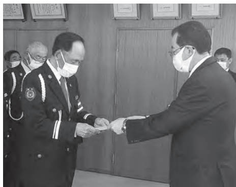
辞令書を受け取る長澤隊長