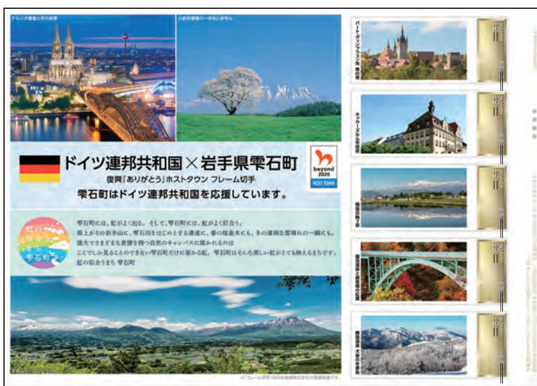
「フレーム切手」は日本郵便株式会社の登録商標です。

【販売場所】県内北部の郵便局で販売。インターネットでの販売はありません。詳しくは、日本郵便株式会社のホームページをご確認ください。