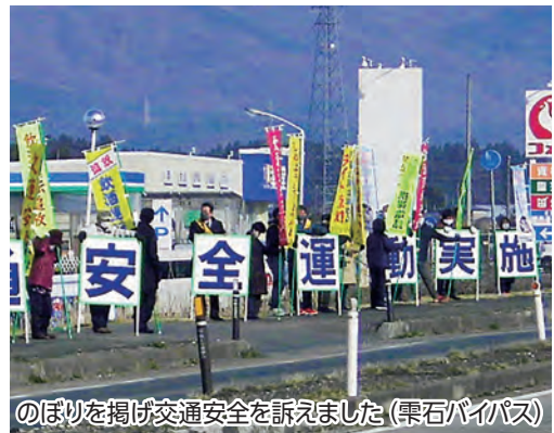
のぼりを掲げ交通安全を訴えました(雫石バイパス)

肌寒い早朝から、防犯交通安全協会役員や老人クラブ、PTA 会員、町交通指導隊など約180人が、国道46号雫石バイパス、東町、沼返の3カ所の沿道に立ち「薄暮時の早めのライト点灯」や「飲酒運転追放」などののぼりを掲げて運転中のドライバーに交通安全を訴えました。