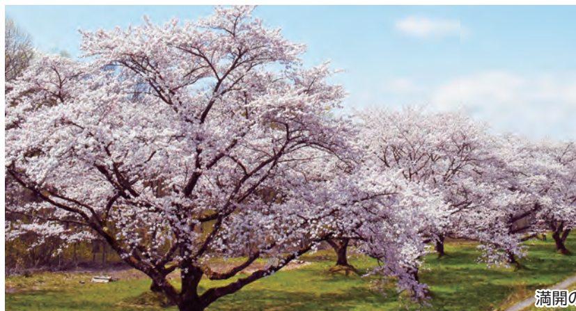
満開の桜が1.5kmにわたり咲き誇っていました(20日)

満開となり見頃を迎えた20日は天候にも恵まれ、時折風に揺られる満開の桜を背に写真撮影をしたり、並木脇の堤防を散歩するなど、園地は咲き誇る桜を楽しむマスク姿の人たちで静かににぎわっていました。