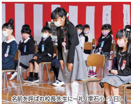
名前を呼ばれ校長先生に一礼(雫石小・7日)