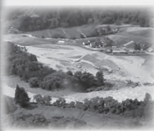
上空から見た小赤沢集落（8月10日） 竜川が決壊し水田などが流された 当時の10大ニュース第1位 ※文章は一部抜粋しています