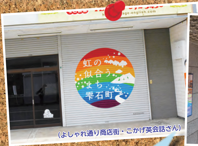
(よしゃれ通り商店街・こかげ英会話さん)

このページでは、町民の皆さんとともにシティプロモーションの機運を高めていくため、町内外で現在進行しているさまざまなシティプロモーションの取り組みについて紹介していきます。