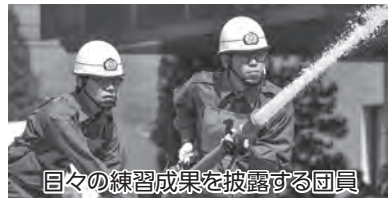
目々の練習成果を披露する団員

また、町では消防団員を随時募集しています。入団に関するお問い合わせは防災課(☎692・6410)までお願いします。