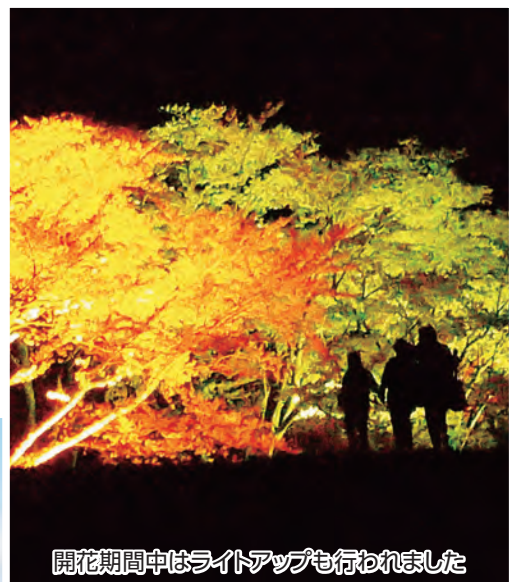
開花期間中はライトアップも行われました