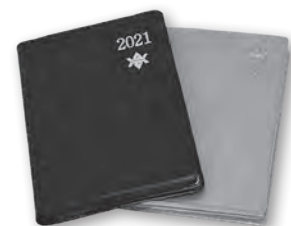
岩手県能率手帳（左）と岩手県民手帳（右）