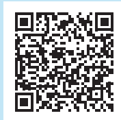
▲にじいろ保育園概要

6月1日、雫石町で初めてとなる小規模保育所「にじいろ保育園」が開園しました。小規模保育所とは、待機児童が多い0歳から3歳児を対象とした、定員が6人以上19人以下の少人数で行う保育施設です。一人の保育スタッフが担当する子どもの数が少ないため、手厚く子どもの発達に応じた質の高い保育が提供でき、待機児童問題の解消策としても期待されています。