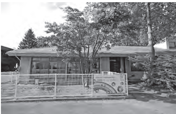
▲にじいろ保育園は雫石町社会福祉協議会が運営します

神地区の旧雫石診療所御明神出張診療所の一部を改装し、保育園としました。木造平屋建てで、敷地内には園庭もあり、また保育園の窓からは、岩手山や秋田新幹線を間近で見ることができ、子どもたちに喜んでもらえる環境となっています。 随時入所児童を受け付けているほか、保育園の見学もできますのでお気軽にお問い合わせください。 ◎健康子育て課子ども子育て支援室 ☎601・5428、にじいろ保育園 ☎681・8282