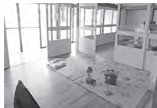
▲内装を保育用に整備

子どもたちの成長と発達を見守る手厚い保育と現場復帰される家族の手助けができるよう、また待機児童の解消を図る目的で、町社会福祉協議会が運営する西山保育園が、御明