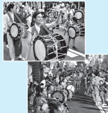
昨年の雫石よしゃれ祭の様子