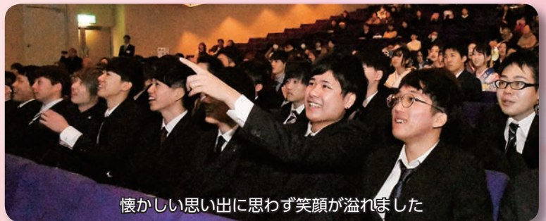
懐かしい思い出に思わず笑顔が溢れました