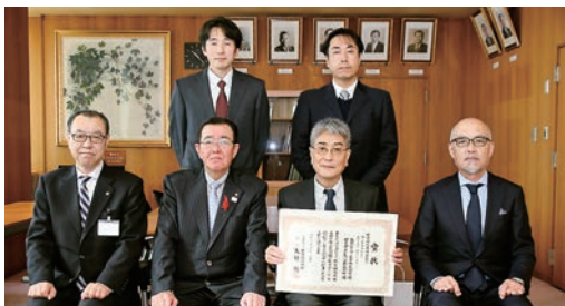
▲賞状を掲げる盛岡セイコー工業（株）の皆さん（前右2人、後列）

この表彰は、緑豊かな都市づくり・まちづくりの成果を上げている企業や市民団体などを顕彰しており、同社は、工場緑地の質を高める改善や適正な維持管理を行い、事業と環境との共存を常に意識している取り組みが評価され、今回の受賞となりました。