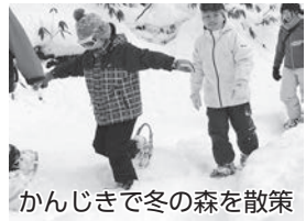
かんじきで冬の森を散策

12日には網張ビクターセンターで雪国に昔から伝わる「和かんじき」を履き、冬の森を散策しました。雪が積もっている時期だけ歩ける冬の森で深く積もった雪の上を歩き、小動物の形跡や、木の周りには雪が積もらないことなど、冬の森ならではの発見をしました。和かんじきのおかげで雪の上でも簡単に歩くことができ、参加者は雪の上を走ってみたい寝転んでみたいと楽しんでいました。