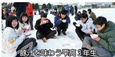
豚汁を味わう雫高3年生

運動会終了後にはPTAから豚汁と餅が振る舞われ、生徒たちは体を温めながら競技の余韻に浸っていました。