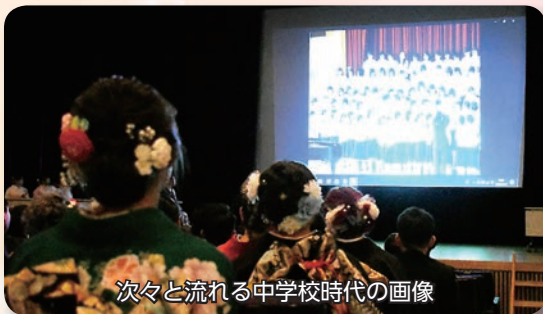
次々と流れる中学校時代の画像