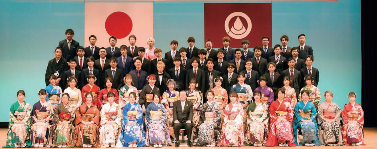
御所・御明神・西山地区新成人