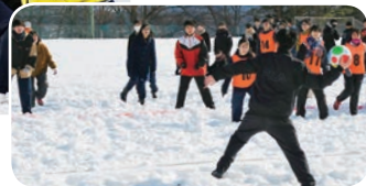
雪上ドッジボール▶