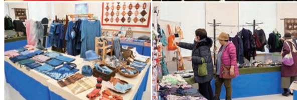
温もりに溢れた手づくりの布製品が並びました