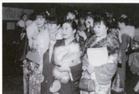
ロビーでは新成人たちが記念撮影 本町の成人式は昭和四十一年から平成十年まで夏に行われていたが、三十三年ぶりに冬の成人式となりました。 変更した理由は、今まで成人を迎えた人々からのアンケート結果や、本来の祝日に戻したいということ。また来年一月から、月曜日、成人の日に変更。

本町の成人式は昭和四十一年から平成十年まで夏に行われていたが、三十三年ぶりに冬の成人式となりました。 変更した理由は、今まで成人を迎えた人々からのアンケート結果や、本来の祝日に戻したいということ。その青春まつり中の若者たち三百六人(成人式当日は百七十一人)が「大人の仲間入り」をしました。式典終了後には久しぶりの同級生たちとの再会に瞳を輝かせて、会話を弾ませる新成人たちがいました。