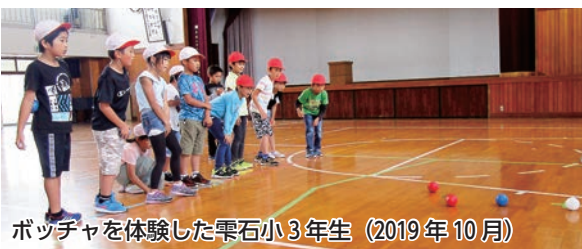
ボッチャを体験した栗石小3年生 (2019年10月)

ボッチャは、ヨーロッパで障がいのある人のために考案されたスポーツで、パラリンピックの正式種目です。ルールは単純ですが緻密な戦略や正確な投球が醍醐味で、道具とコートスペースがあれば、老若男女、障がいの有無に関わらず、全ての人が一緒に競い合えるユニバーサルデザインなスポーツです。