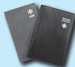
町役場で販売中の岩手県民手帳と岩手県能率手帳