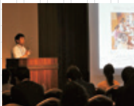
8月5日、地域おこし協力隊員の「過去・現在・未来」をテーマに、「盛岡クラブ」で講演を行いました。

残された任期が少なくなりつつあり、焦りの気持ちも生まれてきていますが、充実した日々を送らせてもらっている雫石への恩返しを少しでもしたいと思っています。どうぞよろしくお願いいたします。