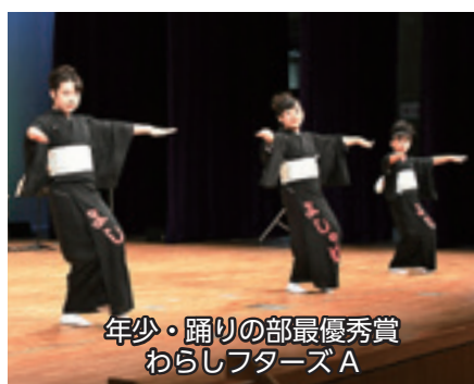
年少・踊りの部最優秀賞 わらしフターズA

矢巾町民謡保存会（矢巾町）【3～5位】昭和ガールズ（雫石町）、よし子ばあさんとい