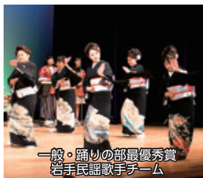
一般・踊りの部最優秀賞 岩手民謡歌手チーム