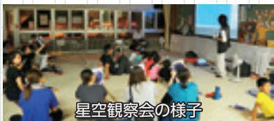
星空観察会の様子