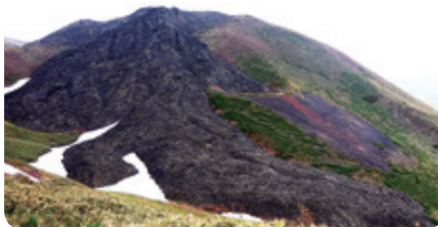
秋田駒ヶ岳の噴火跡(溶岩流)

これらの中でも特に、 大きな噴石 、 火砕流 および 融雪型火山泥流 は、発生から避難までの時間的猶予がほとんどなく生命に対する危険性が高いため、防災対策上重要度の高い火山現象として位置付けられており、事前の噴火警報や避難計画を活用した早め早めの避難が必要となります。