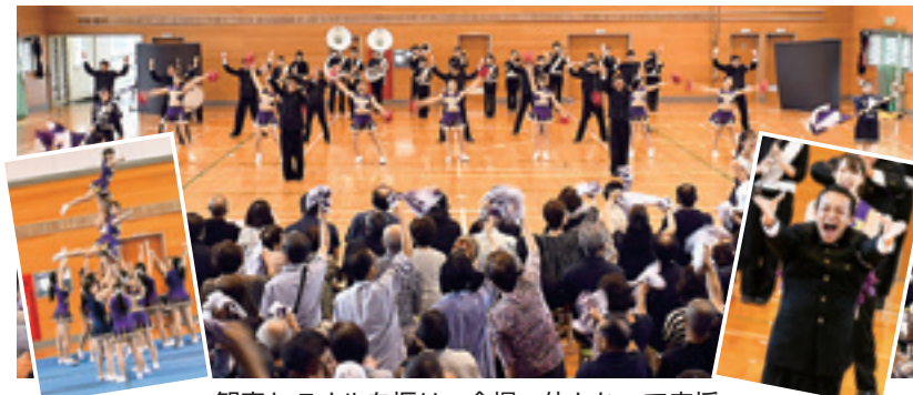
観客もタオルを振り、会場一体となって応援

8月28日、旧南畑小学校で「明治大学応援団 夏季合宿成果発表会」が開かれ、町民や大学OBなど約300人が大迫力の応援を楽しみました。