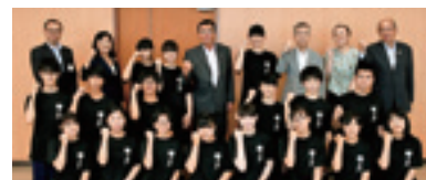
全国大会出場を報告した郷土芸能委員会(写真左)と全国大会での演舞(同下)

全国大会は7月30日～8月1日、佐賀県の武雄市文化会館で開かれ、同委員会は「上駒木野さんさ」を披露。6年越しの夢の舞台上で堂々の演舞を繰り広げ、文化連盟賞を受賞しました。