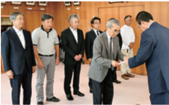
辞令書を受け取る管理委員