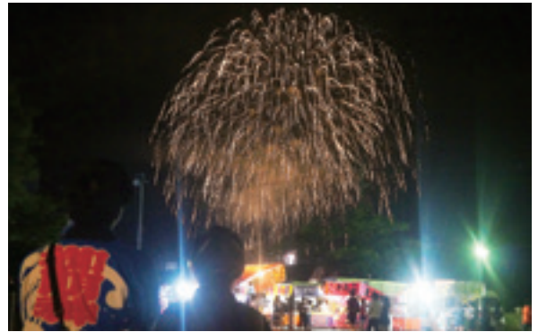
夏まつりのフィナーレを飾った大花火大会

8月18日、「第41回御明神夏まつり」が御明神公民館駐車場などで開かれました。地区住民手づくりによるこの祭りは、御明神夏まつり実行委員会を中心に準備を進め、今年で41回目を迎えました。