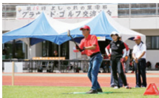
熱いプレーを繰り広げる参加者

よしやれ月間を締めくくる「よしやれの里雫石グラウンド・ゴルフ交流大会」が8月27日、町総合運動公園内の特設コースを舞台に開催されました。当日は晴れ空の下、町内外から445人のグラウンド・ゴルフ愛好者が集結し、町内からは47人が出場。紅・白ブロックに分かれ、芝生の上の熱い戦いを繰り広げるとともに、交流を深めました。