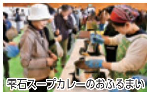
栗石スープカレーのおふるまい