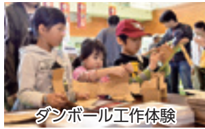
ダンボール工作体験