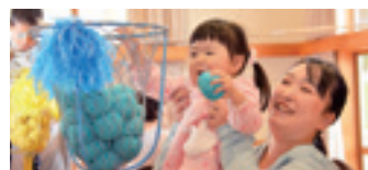
◀▲運動会ごっことハロウィンイベントを楽しむ親子