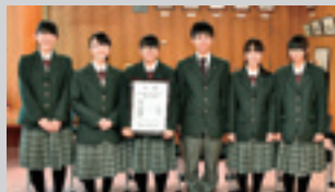
受賞報告で町役場を訪れた郷土芸能委員会の生徒

栗石高校郷土芸能委員会が、10月13日に北上市で行われた「第41回岩手県高等学校総合文化祭」の郷土芸能発表会で“優秀賞第一席”を受賞し、全国大会への切符を手にしました。第43回全国高等学校総合文化祭郷土芸能部門は、来年7月30日～8月1日、佐賀県武雄市で開催予定です。