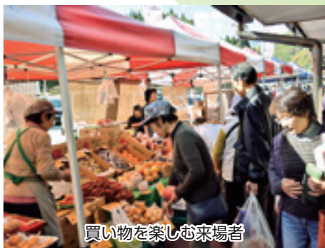
買い物を楽しむ来場者