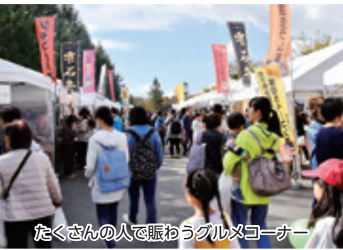
たくさんの人で賑わうグルメコーナー

2018しずくしいし産業まつり（同実行委員会主催）が10月20日と21日の2日間、総合運動公園で開催されました。会場では、毎年好評の丸太早切り競争、餅つき振る舞い、魚つかみ取りなどの楽しいイベントが行われたほか、栗石牛焼肉、人気の屋台、新鮮産直野菜の販売、工芸品展示販売などグルメ・物販コーナーも充実。 さわやかな秋晴れのもと、両日合わせて約2万1000人が来場し、実りの秋を満喫しました。