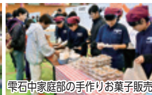
栗石中家庭部の手作りお菓子販売