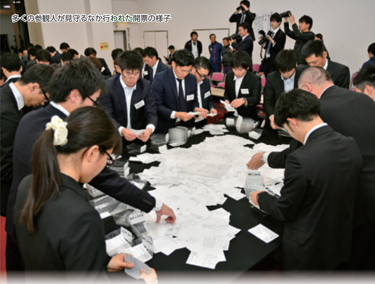
多くの参観人が見守るなか行われた開票の様子