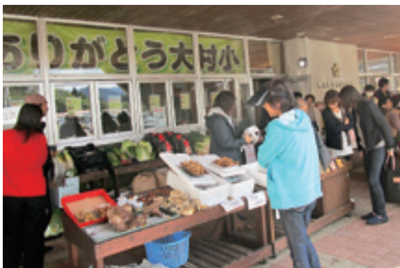
買い物を楽しむ来場者

10月13日～14日、旧大村小学校利活用実行委員会は、「春の収穫市」、「夏の収穫市」に引き続き、「秋の収穫市」を開催しました。