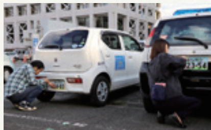
公用車に富士山図柄入りナンバープレートを取り付ける様子

岩手県内でも、「銀河鉄道の夜」をモチーフにしたデザインをはじめ、3種類の図柄入りナンバープレートの交付が始まり、話題になっていることと思います。富士山ナンバーは全国で唯一、山梨県側と静岡県側で異なる2種類の図柄が導入されたご当地ナンバーです。国土交通省