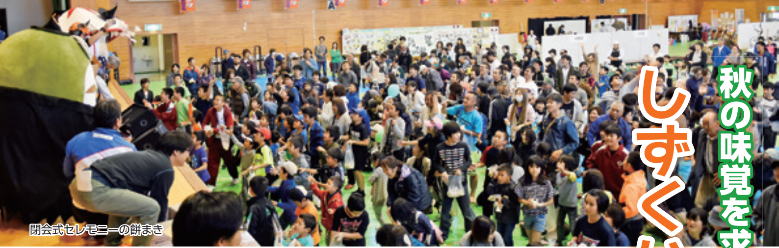
閉会式セレモニーの餅まき