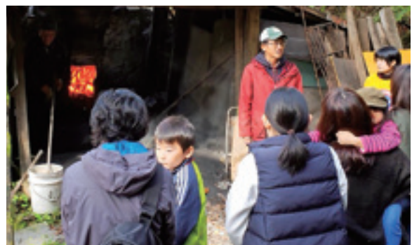
炭焼き職人の窯を見学する参加者

昨年、西山マップチームは、西山地区の住民でも知らないようなディープなスポットに焦点を当てた「西山マップ」を製作。今回は、そのマップを活用して、知られざる炭焼き職人の窯を見学し、その炭を使ったバーベキューイベントを行いました。天候にも恵まれ、24人の参加者は西山地区の奥深い魅力を十分に堪能しました。