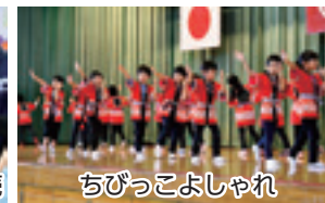
ちびっこよしゃれ