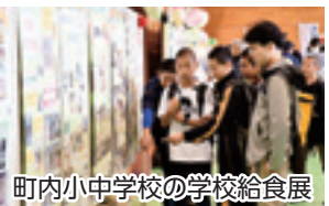
町内小中学校の学校給食展

2018しずくしいし産業まつり（同実行委員会主催）が10月20日と21日の2日間、総合運動公園で開催されました。会場では、毎年好評の丸太早切り競争、餅つき振る舞い、魚つかみ取りなどの楽しいイベントが行われたほか、栗石牛焼肉、人気の屋台、新鮮産直野菜の販売、工芸品展示販売などグルメ・物販コーナーも充実。 さわやかな秋晴れのもと、両日合わせて約2万1000人が来場し、実りの秋を満喫しました。