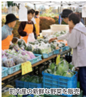
町内産の新鮮な野菜を販売