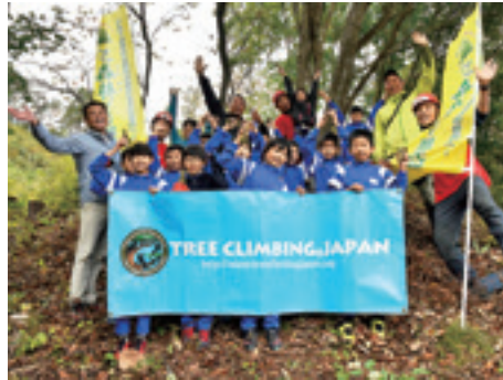
木や自然とふれあった七ツ森小の4年生