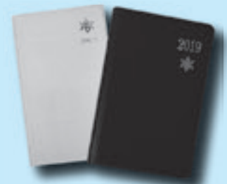
町役場で販売中の岩手県民手帳と岩手県能率手帳