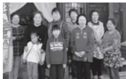
「大村きのこセンター」の有志スタッフの皆さん

大村小学校の「収穫市」に手芸品を出品するなど、地域住民同士の連携した取り組みの輪がどんどん広がっています。さまざまな人が気軽に立ち寄れる「みんなのお休み処」として来年も活動する予定ですので、皆さんぜひお立ち寄りください。