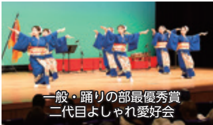
一般・踊りの部最優秀賞 二代目よしやれ愛好会