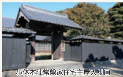
小休本陣常盤家住宅主屋入り廻り

東海道五十三次の宿場町、吉原宿(現▷富士市吉原)と蒲原宿(現▷静岡市清水区)の間には日本三大急流の一つ・富士川が流れており、参勤交代の大名や旅人などは、渡船で川を渡っていました。富士川右岸の渡船場であり、甲斐(現▷山梨県)からの年貢米などを水揚げする河岸場でもあった岩淵村(現▷富士市岩淵)は、間宿(あいのしゆく)として栄えました。国の登録有形文化財である小休本陣常盤家住宅主屋入り廻り