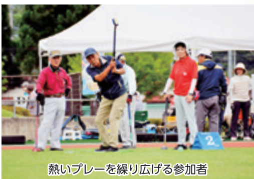
熱いプレーを繰り広げる参加者

よしやれ月間を締めくくると「よしやれの里雫石グラウンド・ゴルフ交流大会」が8月28日、町総合運動公園内の特設コースを舞台に開催されました。当日は雨天の中、町内外から508人のグラウンド・ゴルフ愛好者が集結し、町内からは63人が出場。紅・白・ブロックに分かれ、芝生の上の熱い戦いを繰り広げるとともに、交流を深めました。