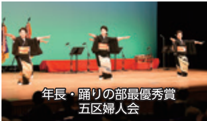
年長・踊りの部最優秀賞 五区婦人会