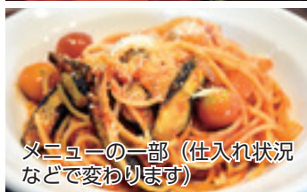
メニューの一部（仕入れ状況などで変わります）