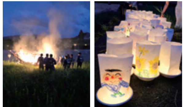
勢いよく燃え盛る舟っことその引き手

今年はいいにくの雨で開催が危ぶまれましたが、灯ろう流しや舟っこ流し、盆踊りや大花火大会などが盛大に行われ、御明神地区の夏を彩りました。