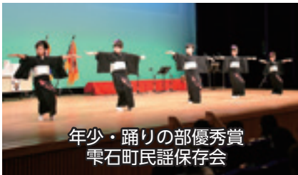
年少・踊りの部優秀賞 雫石町民謡保存会

はじめ全国から唄い手113人、踊り手10団体64人が参加。最年少5歳から最年長86歳までの出演者が日本一を目指し熱演のステージを繰り広げました。伸びやかな唄声や息の合った華麗な踊りに、約600人の観客からは大きな拍手と声援が送られました。