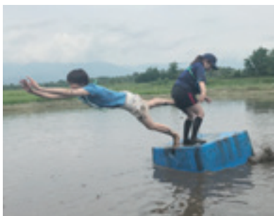
尻相撲で見事なダイビングを披露