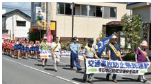
約 300 人による夏の防犯交通安全パレード

9月21日からは、秋の全国交通安全運動が実施されます。交通ルールの遵守と交通マナーの実践により交通事故防止の徹底を心がけましょう。