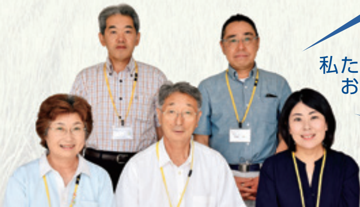
農業指導センターの専門指導員の皆さん