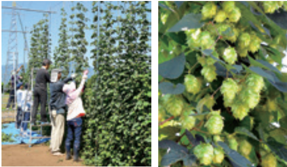
ホップ収穫の様子

ホップは柑橘系の香りで、ツルの高さは4メートルほどあります。クラブ員らは、この先できる雫石産ベアレンビールを思いながら、丸い花（穂花）を一つ一つ大切に収穫しました。