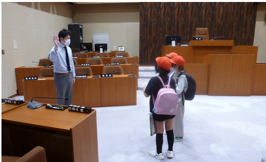
雫石町議会の議場を見学する児童

雫石小学校4年生は、総合的な学習の時間に、『雫石の昔・今・未来』というテーマで学習を行っています。2学期は『雫石の今』の様子について知るため、10月12日(木)によしやれ通り方面、10月13日(金)に田園地帯方面を実際にあるき、地域点検を行いました。