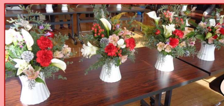
素晴らしい作品が勢揃い