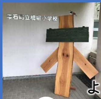
宇石町立橋場小学校