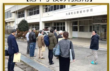
【旧中学校の利活用】