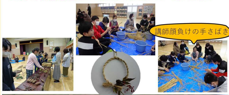
講師顔負けの手さばき

5年生は、初体験の児童が多かったが、わらの扱いも上手で、全員でリースを完成することができました。松ぼっくりや南天の実で飾りつけ、それぞれ個性溢れる素敵な作品となりました。