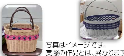
写真はイメージです。実際の作品とは、異なります。

《申込・問合せ》 御明神公民館 019-692-3228 (平日9:00-17:00) E-mail:myoukou@town.shizukuishi.iwate.jp