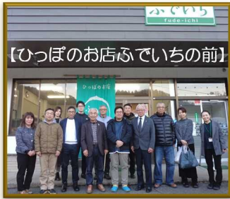
【ひっぼのお店ふでいちの前】