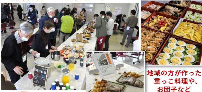
地域の方が作った重っこ料理やお団子など

「重っこ料理」と御所地区・雫石町にちなんで準備されたお茶菓子でひと息ついた後は、参加者同士リラックスした様子で情報交換をしたり、交流を深めていました。